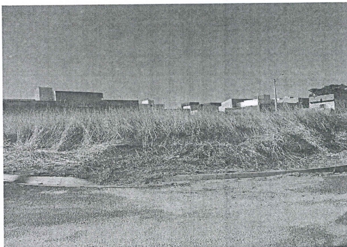
FOTOGRAFIA DO IMÓVEL

Atendida a notificação o responsável pelo imóvel deverá, por meio de requerimento e de forma escrita comunicar a Prefeitura para que não seja lavrada a multa