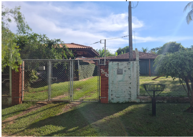
FOTO 02 Pessoas na edificação em 20-03-21