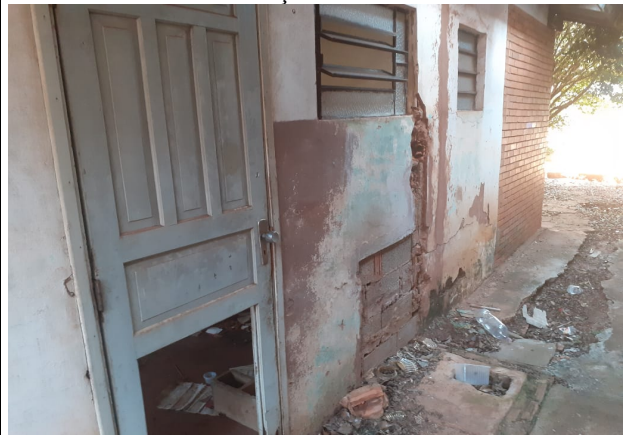
FOTO 03 Fissura no oitão.