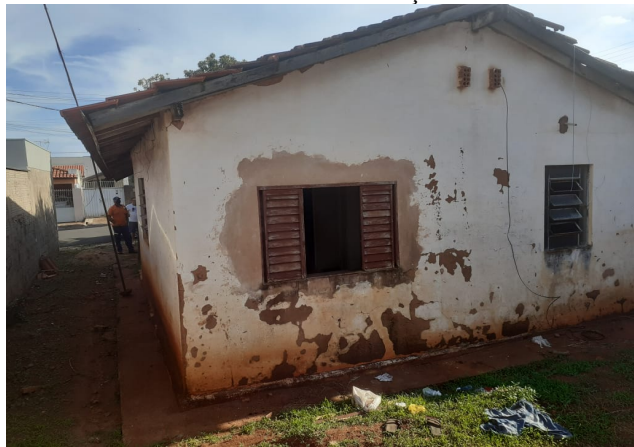
FOTO 02 Edificação em ruínas