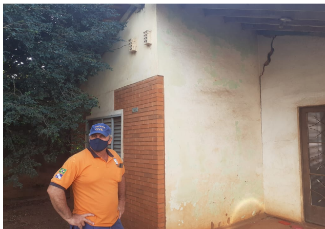
FOTO 04 Fissura e acúmulo de lixo no interior da edificação