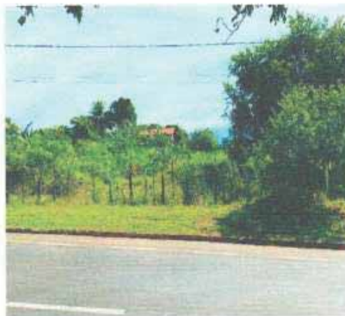
VISTA DA VIA DO LOTE