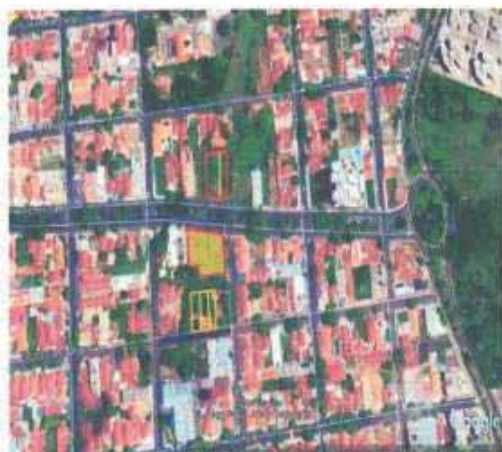
VISTA ÁREA DO LOTE

Tipo: Terreno CEP: Nº: Complemento Endereço: Rua Bahia- Lote 10 Distrito: Bairro: Jardim Sumaré Cidade: Araçatuba UF: SP Zoneamento: ZEIS 01