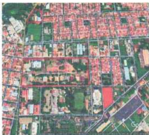
VISTA ÁREA DO LOTE

Tipo: Terreno CEP: Nº: Complemento Endereço: Rua Alcides Fagundes Chagas Distrito: Bairro: Aviação Cidade: Araçatuba UF: SP Zoneamento: ZEIS 01