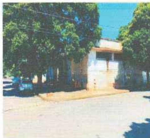
VISTA DA VIA DO LOTE