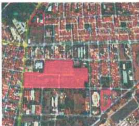
VISTA ÁREA DO LOTE

Tipo: Terreno CEP Nº: Complemento Endereço: Maurício de Nassau, 1997 Distrito: Bairro: Aviação Cidade: Araçatuba UF: SP Zoneamento: ZEIS 01