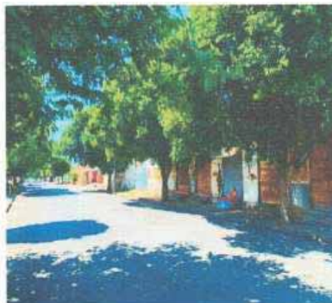
VISTA DA VIA DO LOTE