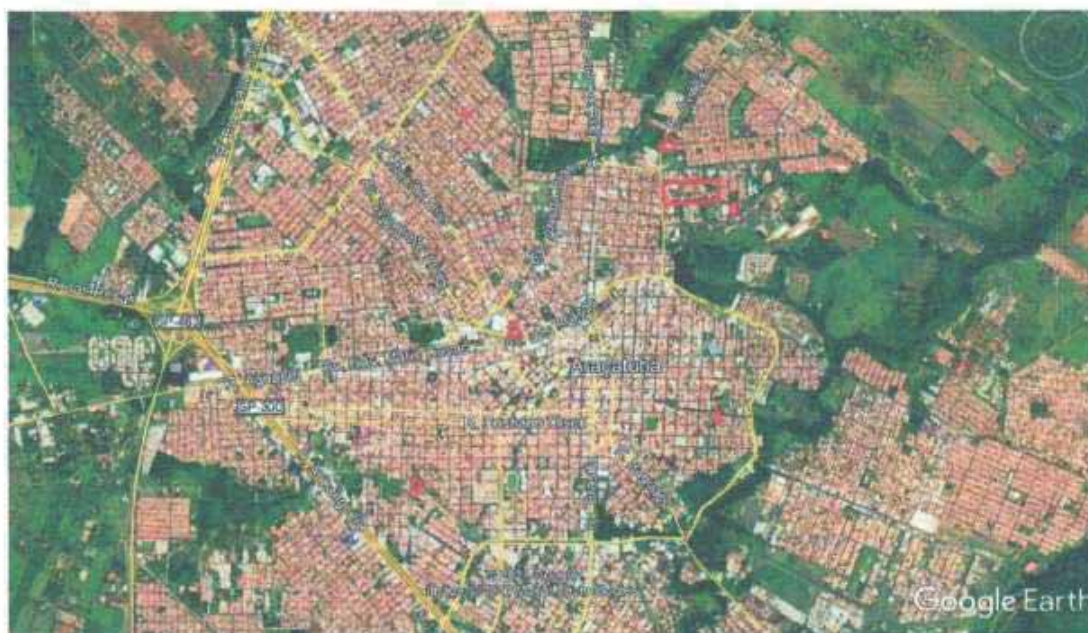
Figura 1 – Macrolocalização dos lotes.

Os lotes avaliados situam-se ao noroeste do Estado de São Paulo, no município de Araçatuba, localizado a aproximadamente 522 km da capital e estão distribuídos entre os Bairros Amizade, São Joaquim, Aviação, Vila Mendonça, Jardim Sumaré e Bairro das Bandeiras, conforme figura 1 abaixo.