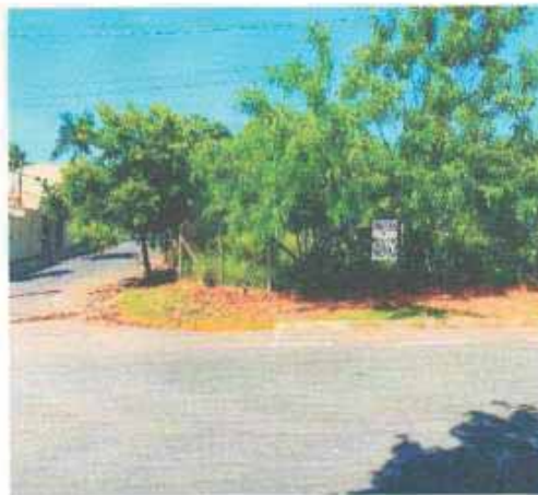
VISTA DA VIA DO LOTE