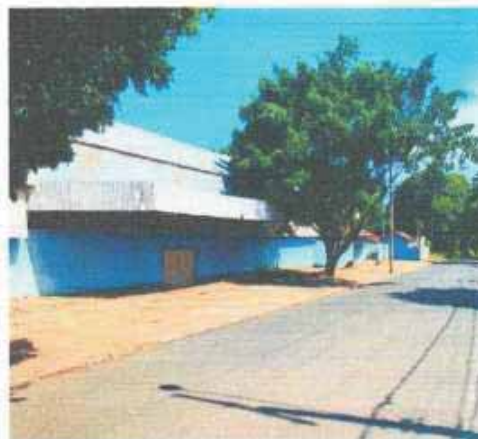
VISTA DA VIA DO LOTE