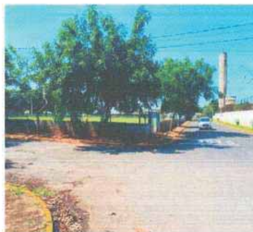
VISTA DA VIA DO LOTE