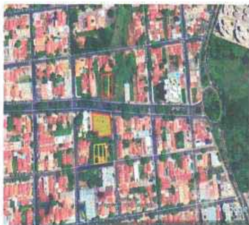
VISTA ÁREA DO LOTE

Tipo: Terreno CEP Nº: Complemento Endereço: Av. dos Estados, Lote 07 Distrito: Bairro: Jardim Sumaré Cidade: Araçatuba UF: SP Zoneamento: ZEIS 01