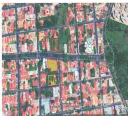
VISTA ÁREA DO LOTE

Tipo: Terreno CEP: Nº: Complemento Endereço: Avenida dos Estados, Lote 06 Distrito: Bairro: Jardim Sumaré Cidade: Araçatuba UF: SP Zoneamento: ZEIS 01