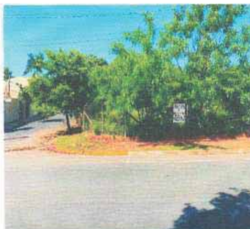
VISTA DA VIA DO LOTE