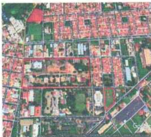
VISTA ÁREA DO LOTE

Tipo: Terreno CEP: Nº: Complemento Endereço: Rua Abramo Gon Destrito: Bairro: Aviação Cidade:Araçatuba UF: SP Zoneamento: ZEIS 01