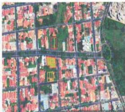
VISTA ÁREA DO LOTE

Tipo: Terreno CEP: Nº: Complemento Endereço: Av. dos Estados - Lote 05 Distrito: Bairro: Jardim Sumaré Cidade: Araçatuba UF: SP Zoneamento: ZEIS 01