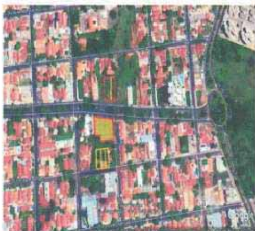
VISTA ÁREA DO LOTE

Tipo: Terreno CEP Nº: Complemento Endereço: Cristiano Olsen, Lote 17 Destruto: Bairro: Jardim Sumaré Cidade: Araçatuba UF: SP Zoneamento: ZEIS 01