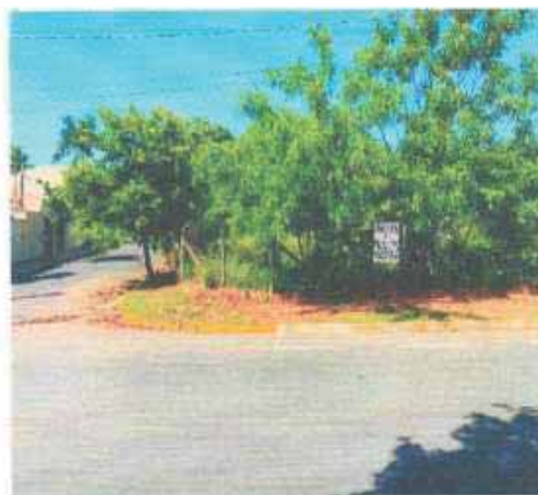
VISTA DA VIA DO LOTE