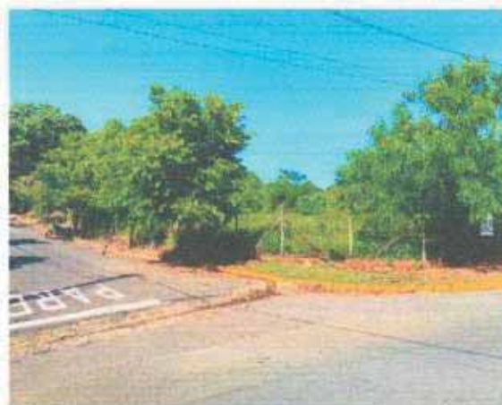
VISTA DA VIA DO LOTE