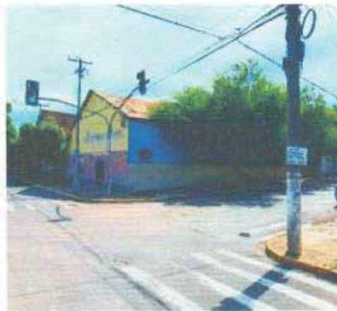
VISTA DA VIA DO LOTE