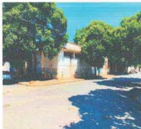
VISTA DA VIA DO LOTE