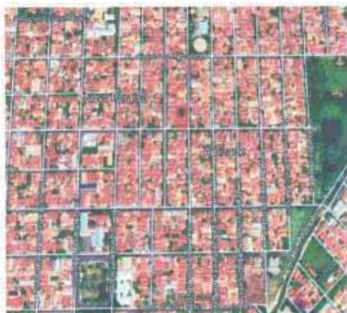
VISTA ÁREA DO LOTE

Tipo: Terreno CEP: Nº: Complemento Endereço: Augusto Keller, Lote 26 Quadra 27 Destrito: Bairro: Jardim Amizade Cidade: Araçatuba UF: SP Zoneamento: ZEIS 01