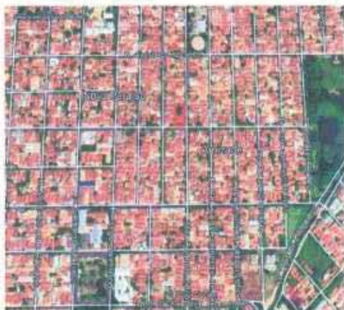
VISTA ÁREA DO LOTE

Tipo: Terreno CEP Nº: Complemento Endereço: Rua Vital Brasil, Lote 28 Quadra 27 Distrito: Bairro: Jardim Amizade Cidade: Araçatuba UF: SP Zoneamento: ZEIS 01