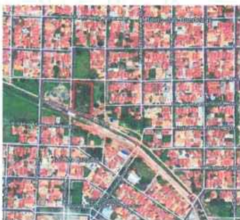
VISTA ÁREA DO LOTE

Tipo: Terreno CEP Nº: Complemento Endereço: Rua Chile, 1015 Destrito: Bairro: Jardim Brasília Cidade: Araçatuba UF: SP Zoneamento: ZEIS 01