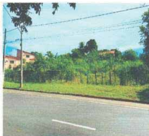
VISTA DA VIA DO LOTE