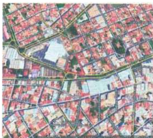
VISTA ÁREA DO LOTE

Tipo: Terreno CEP Nº: Complemento Endereço: Rua Rangel Pestana Distrito: Bairro: São Joaquim Cidade: Araçatuba UF: SP Zoneamento: ZEIS 01