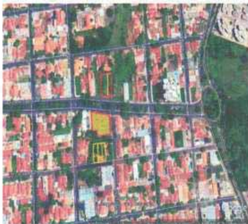
VISTA ÁREA DO LOTE

Bairro: Jardim Sumaré Cidade: Araçatuba UF: SP Zoneamento: ZEIS 01