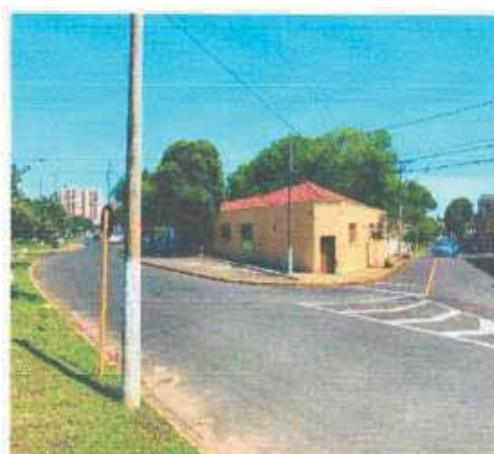
VISTA DA VIA DO LOTE