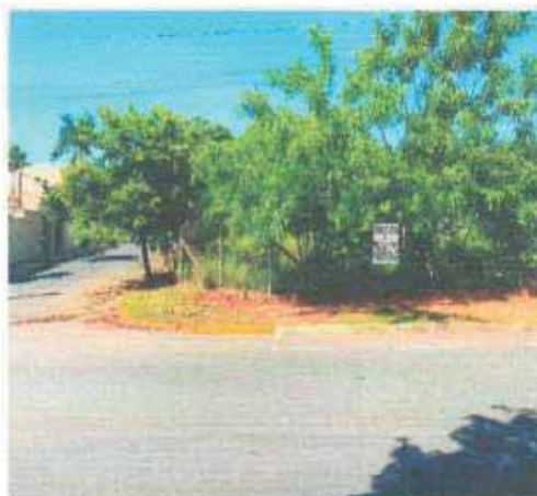
VISTA DA VIA DO LOTE