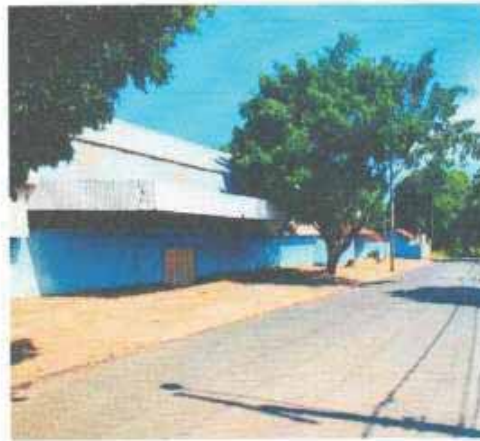
VISTA DA VIA DO LOTE