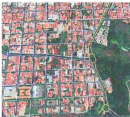
VISTA ÁREA DO LOTE

Tipo: Terreno CEP Nº: Complemento Endereço: Av. dos Estados - Área 1 - Lote 13 e 14 Distrito: Bairro: Vila Mendonça Cidade: Araçatuba UF: SP Zoneamento: ZEIS 01