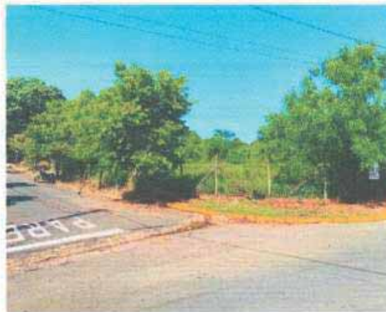
VISTA DA VIA DO LOTE