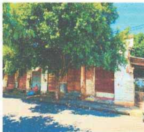
VISTA DA VIA DO LOTE