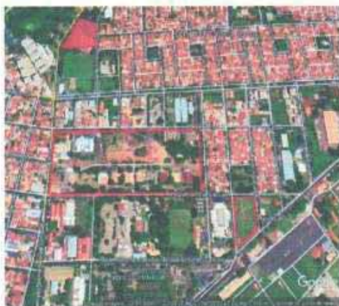
VISTA ÁREA DO LOTE

Tipo: Terreno CEP Nº: Complemento Endereço: Rua Abramo Gon Distrito: Bairro: Aviação Cidade:Araçatuba UF: SP Zoneamento: ZEIS 01