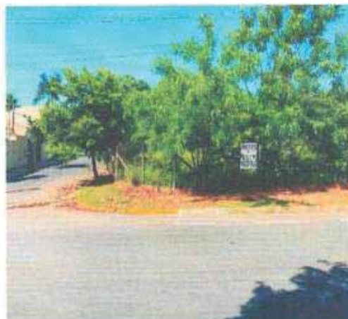
VISTA DA VIA DO LOTE