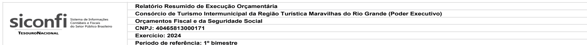
RREO-Anexo 02 | Tabela 2.0 - Demonstrativo da Execução das Despesas por Função/Subfunção | Total das Despesas Exceto Intra-Orçamentárias