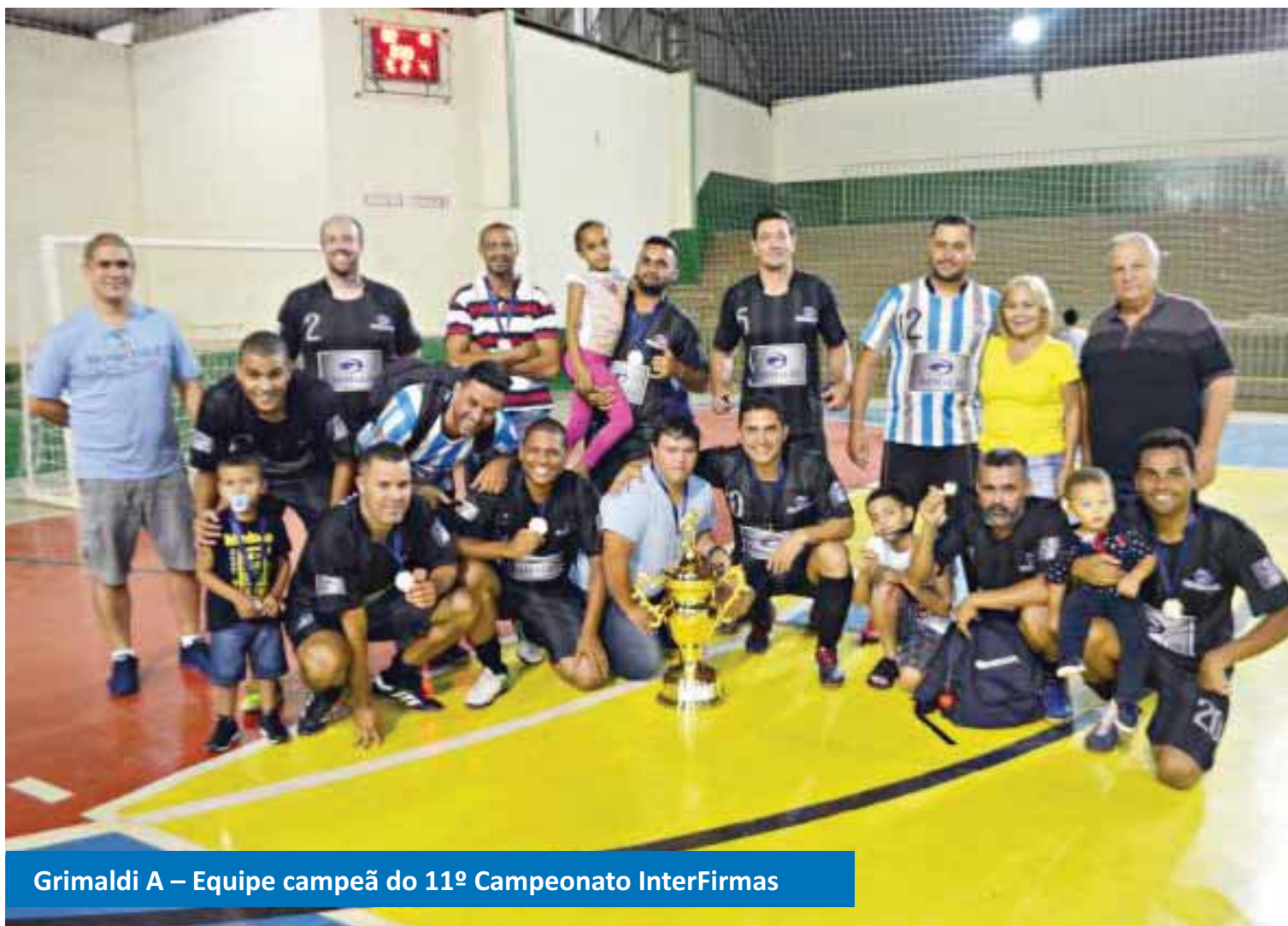
Grimaldi A – Equipe campeã do 11º Campeonato InterFirmas

Mais informações pelo número (19) 3896-4762.