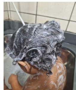
SHAMPOO TRÁ LÁ LÁ