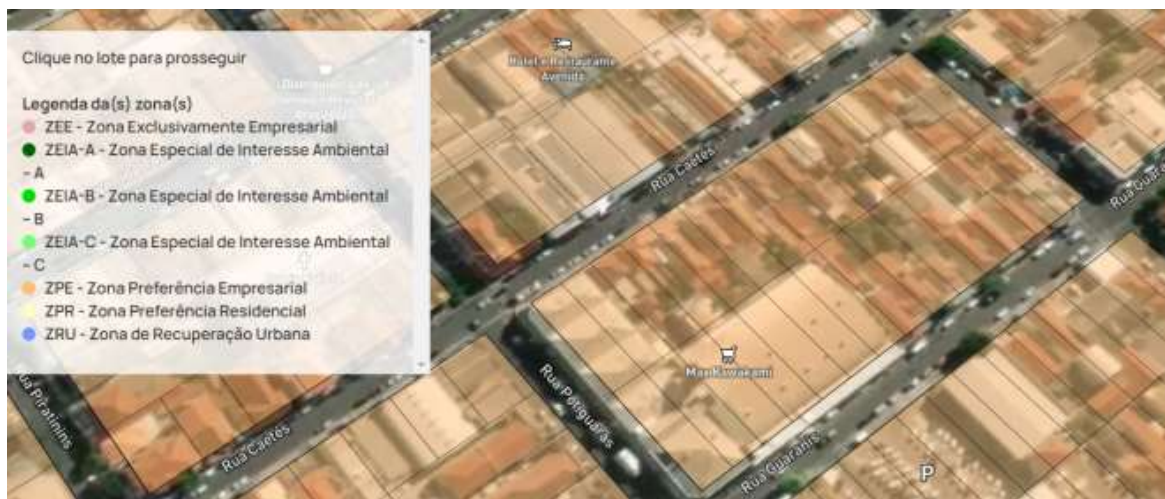
Figura 1 - Localização do empreendimento.