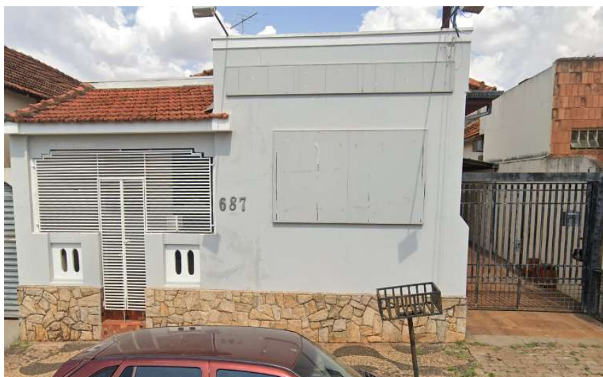
Lateral direita - Residência