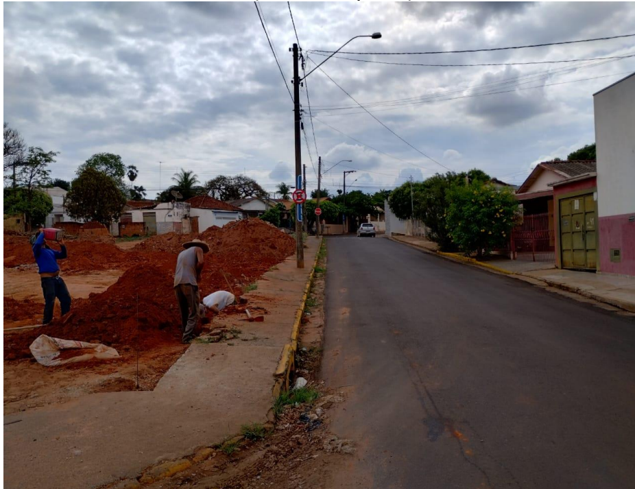
Vista da Rua Nair Ferreira Barbosa ( terreno a direita ) sentido Rua Fraternidade.