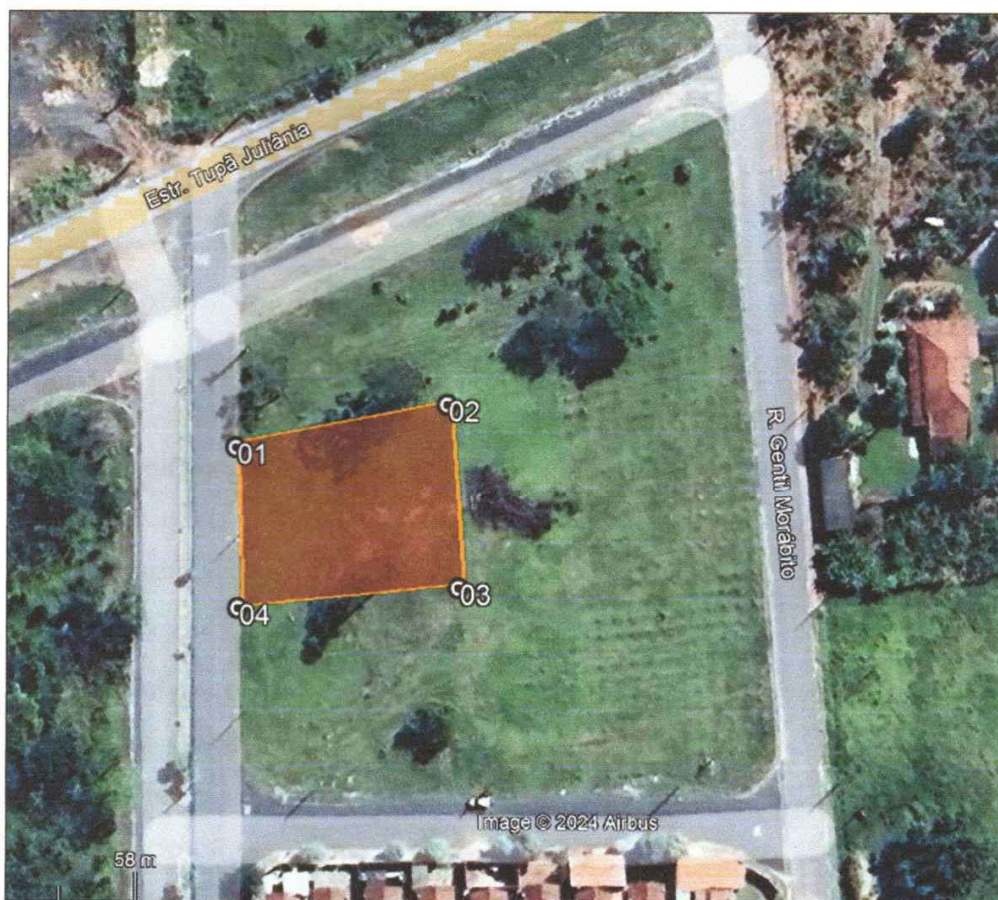
Figura 1 – Delimitação do polígono de plantio para cumprimento de TAC.

5 – Para fins de plantio, devem ser escolhidas mudas nativas do bioma mata atlântica, com tolerância de 10% (15 mudas) para espécies exóticas, não podendo uma mesma espécie corresponder a mais de 20% (30 mudas) do total de mudas plantadas.