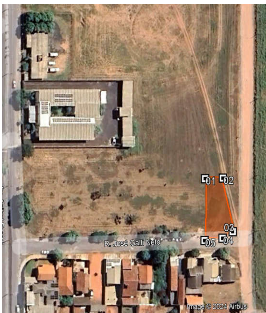
Figura 1 – Delimitação do polígono de plantio para cumprimento de TAC.