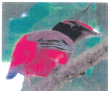
Imagem 06: Ave Saurá

Aspectos gerais: O Saurá ( Phoenicircus carnifex ) é uma ave passeriforme, da Família Cotingidae, encontrada em parte da Amazônia e no estado brasileiro do Maranhão. A Espécie chega a medir até 21 cm de comprimento, com plumagem geral vermelha e secundárias pardas; a fêmea é esverdeada no dorso e acinzentada na garganta e peito. Também é conhecida pelos nomes de anambé-raio-de-sol-pequeno, araciuirá, papa-açaí, saurá-fogo e uiratatá.