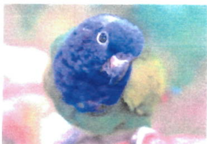
Imagem 09: Ave Maitaca

Aspectos gerais: Maitacas são psitacídeos de pequeno porte, comuns no Brasil, destacando-se pela plumagem verde e o canto típico. O nome traz uma conexão com a avifauna regional.