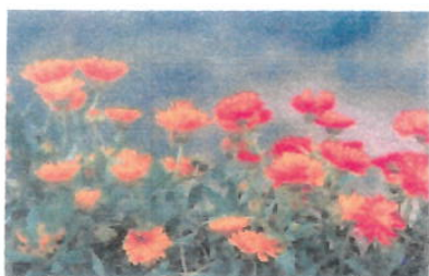
Imagem 18: Flor Calêndula

Aspectos gerais: As calêndulas ( Calendula officinalis ) são flores de tonalidades amarelas e alaranjadas, conhecidas por suas propriedades medicinais e uso decorativo.