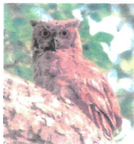
Imagem 10: Coruja Jacurutu

Aspectos gerais: Jacurutus são corujas da espécie Pulsatrix perspicillata , conhecidas como corujas-de-garganta-branca. A alameda destaca a presença desses animais em áreas naturais preservadas.