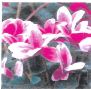
Imagem 25: Flor Ciclame

Aspectos gerais: Os ciclames ( Cyclamen spp.) são flores pequenas e vibrantes, populares em climas temperados. Suas pétalas em formato único são muito apreciadas em arranjos.