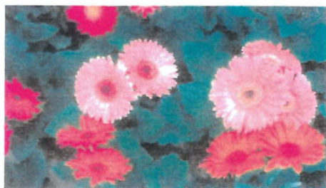
Imagem 17: Flor Gérbera