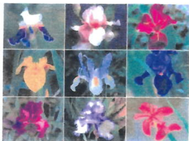
Imagem 24: Flor Iris

Aspectos gerais: A íris ( Iris spp.) é uma flor ornamental conhecida pela diversidade de cores e pela forma elegante, sendo amplamente cultivada em jardins ao redor do mundo.