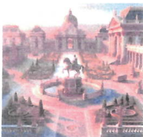
Imagem 03: Praça Imperial

Aspectos gerais: Local de convivência pública, a Praça Imperial homenageia a história e a cultura do período monárquico brasileiro.