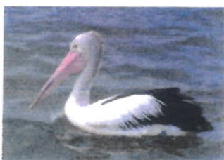
Imagem 08: Ave Pelicano

Aspectos gerais: Pelicanos são aves aquáticas de grande porte da família Pelecanidae, reconhecidos por seu grande bico com bolsa gular. A alameda homenageia essa espécie majestosa e marcante.