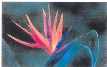
Imagem 22: Flor EntrelíCIA

Aspectos gerais: As entrelíCIAS ( Strelitzia spp.), conhecidas como flores-de-pássaro, destacam-se pelo formato exótico e cores vivas. Simbolizam a tropicalidade e a criatividade.