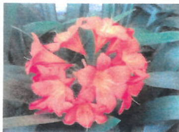
Imagem 23: Flor Clívia