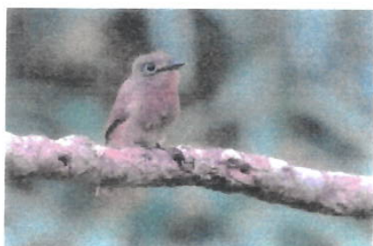
Imagem 16: Ave Macuru

Aspectos gerais: Os macurus ( Pipile cumanensis ) são aves da família Cracidae, nativas das florestas tropicais da Amazônia, encontradas em países como Brasil, Venezuela e Guiana. Com penas escuras e detalhes coloridos na cabeça e pescoço, esses animais vivem em bandos e se alimentam de frutos, sementes e pequenos invertebrados. Embora sejam bons voadores, preferem caminhar ou correr no solo. Infelizmente, muitas espécies de macurus estão ameaçadas devido à perda de habitat e caça, o que os coloca em risco de extinção.