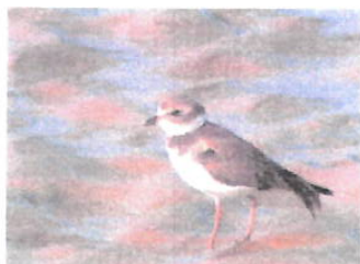
Imagem 05: Ave Bатуíra