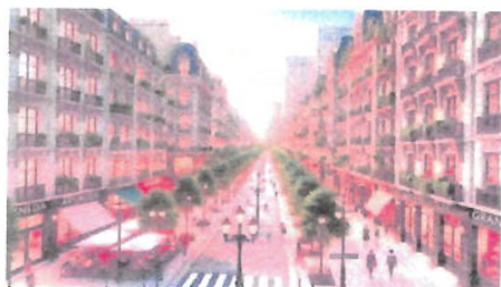
Imagem 04: Imagem gerada pela IA que representa a Avenida Granville.

Aspectos gerais: A Avenida Granville, localizada em várias cidades ao redor do mundo, como no Brasil, tem um nome que remete a forte apelo histórico e cultural. O nome "Granville" é frequentemente associado a cidades ou famílias de tradição europeia, como a cidade de Granville, na França. A escolha de nomes como esse para ruas e avenidas muitas vezes visa conectar a área a um legado de prestígio e história, destacando a identidade local e a preservação de elementos culturais significativos. A mudança ou adoção de nomes como "Granville" reflete o desejo de conservar a memória histórica das localidades, ressaltando elementos culturais e históricos importantes. Essa prática de nomenclatura contribui para fortalecer a identidade das cidades, criando uma ligação simbólica entre o presente e o passado.