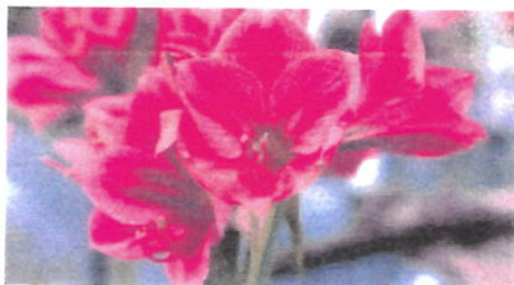
Imagem 26: Flor Amarilis