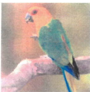
Imagem 04: Ave Jandaia

Aspectos gerais: As jandaias são aves da família dos psitacídeos, conhecidas pelo colorido vibrante e canto alegre. A alameda recebe esse nome em referência a essas aves, criando uma conexão com a fauna brasileira.