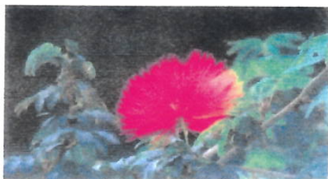
Imagem 02: Flor Calliandra do Cerrado no Parque Nacional da Chapada dos Veadeiros

Aspectos gerais: A avenida homenageia as Calliandras, plantas neotropicais conhecidas por suas flores globosas e vibrantes, que embelezam paisagens e atraem polinizadores. Essas plantas destacam-se por sua delicadeza e adaptação ao clima tropical.