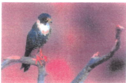
Imagem 14: Ave Cauré

Aspectos gerais: O cauré é uma ave da família Nyctibiidae, conhecida por sua incrível camuflagem, que a ajuda a se misturar aos galhos e troncos durante o dia. Nativo da América do Sul e Central, o cauré é comumente encontrado em florestas tropicais e áreas abertas próximas a corpos d'água. Essa espécie possui hábitos noturnos, alimentando-se principalmente de insetos que captura em voos rápidos e silenciosos. Seu canto melancólico e misterioso contribuiu para seu destaque na cultura popular como uma ave associada a lendas e mistérios.