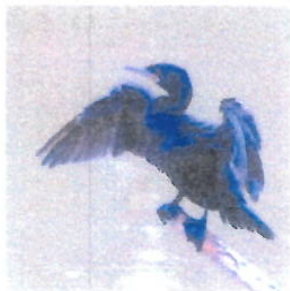
Imagem 07: Aves Biguás

Aspectos gerais: Os biguás são aves aquáticas da família Phalacrocoracidae, conhecidos pela habilidade de pescar mergulhando. Representam a relação entre a urbanização e a fauna de áreas alagadas.