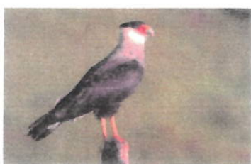
Imagem 11: Ave Carcará

Aspectos gerais: Os carcarás ( Caracara plancus ) são aves de rapina da família Falconidae, conhecidas por sua adaptabilidade e inteligência. Esses animais são encontrados em diferentes biomas brasileiros, especialmente em áreas abertas como campos e cerrados.