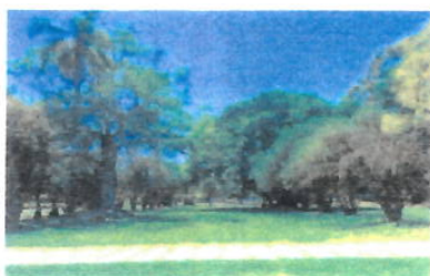
Imagem 19: Árvores

Aspectos gerais: Espaço público que homenageia a diversidade da flora brasileira, com árvores nativas e ornamentais. A praça promove o convívio social e o contato com a natureza.