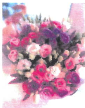
Imagem 20: Flor Lisianthos