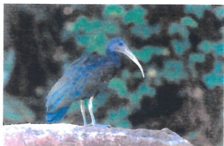
Imagem 15: Ave Caraúna

Fonte: Galinhas-d'água - WikiAves . Acesso em: 25 nov. 2024.