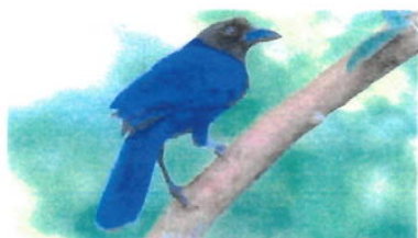
Imagem 13: Gralha Azul

Aspectos gerais: A gralha é uma ave da família Corvidae, conhecida por sua inteligência e comportamento social. Entre as espécies mais famosas está a gralha-azul ( Cyanocorax caeruleus ), encontrada no sul do Brasil. Com penas azuis e pretas, ela é reconhecida pela habilidade de resolver problemas, imitar sons e coletar objetos brilhantes. Além disso, as gralhas desempenham um papel importante na dispersão de sementes, ajudando na reprodução de plantas. Essas aves são também símbolos de sagacidade e, no folclore, associadas à sorte e à comunicação com espíritos.