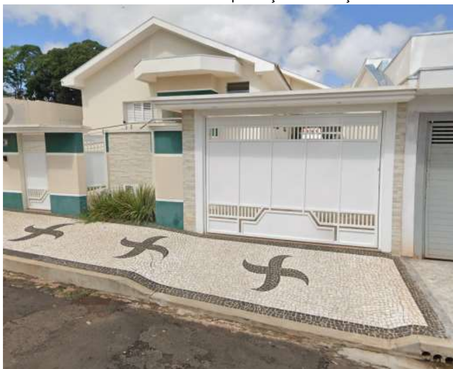
Fundos - Imóvel comercial com locação de serviços.