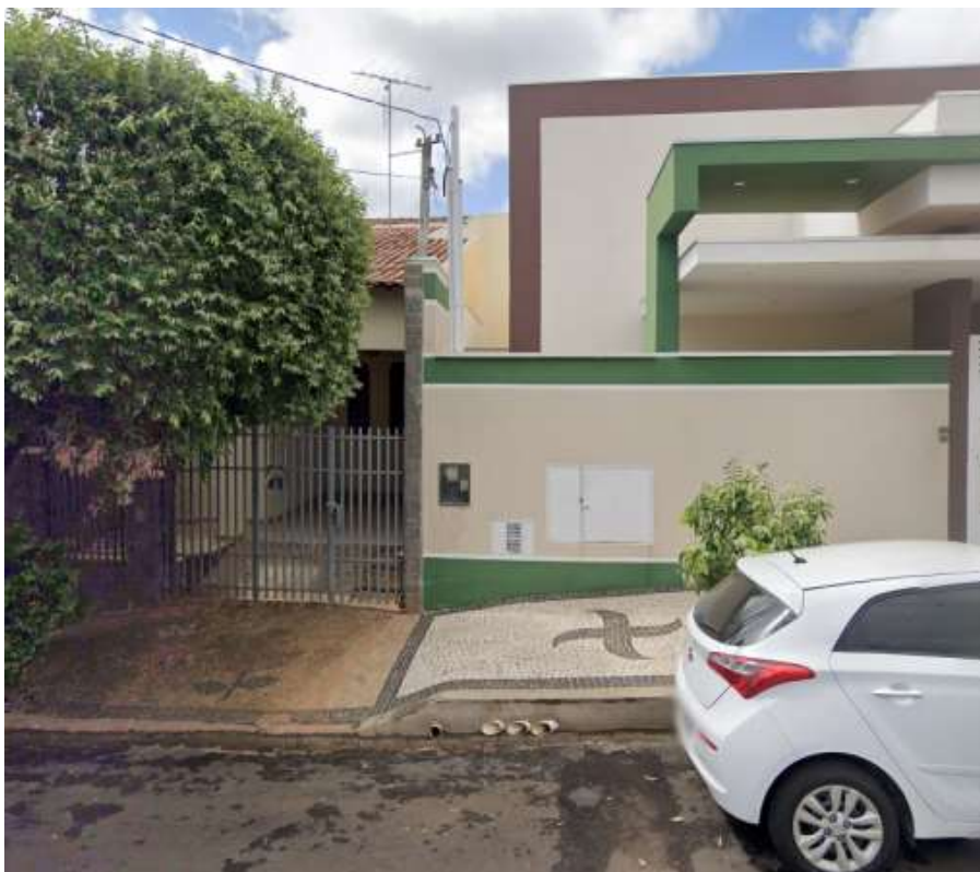
Lateral direita - Comercial