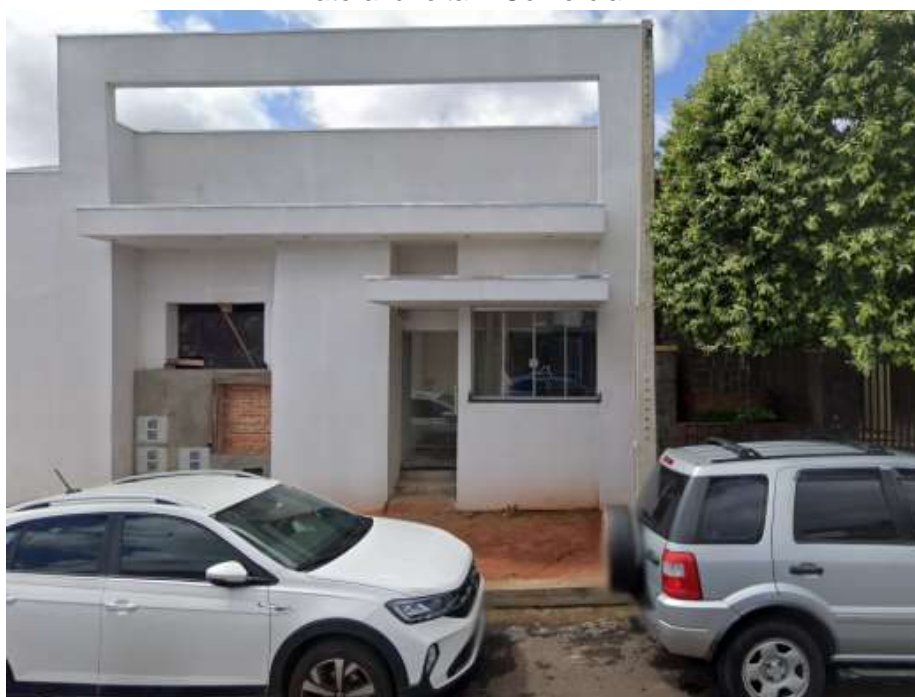
Lateral esquerda - Comercial em construção