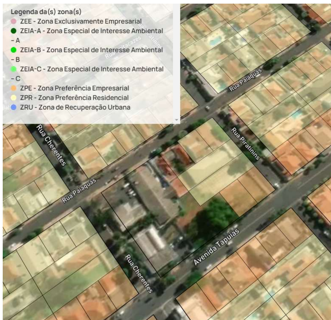
Figura 1 - Localização do zoneamento do imóvel existente a ser reformado e ampliado.