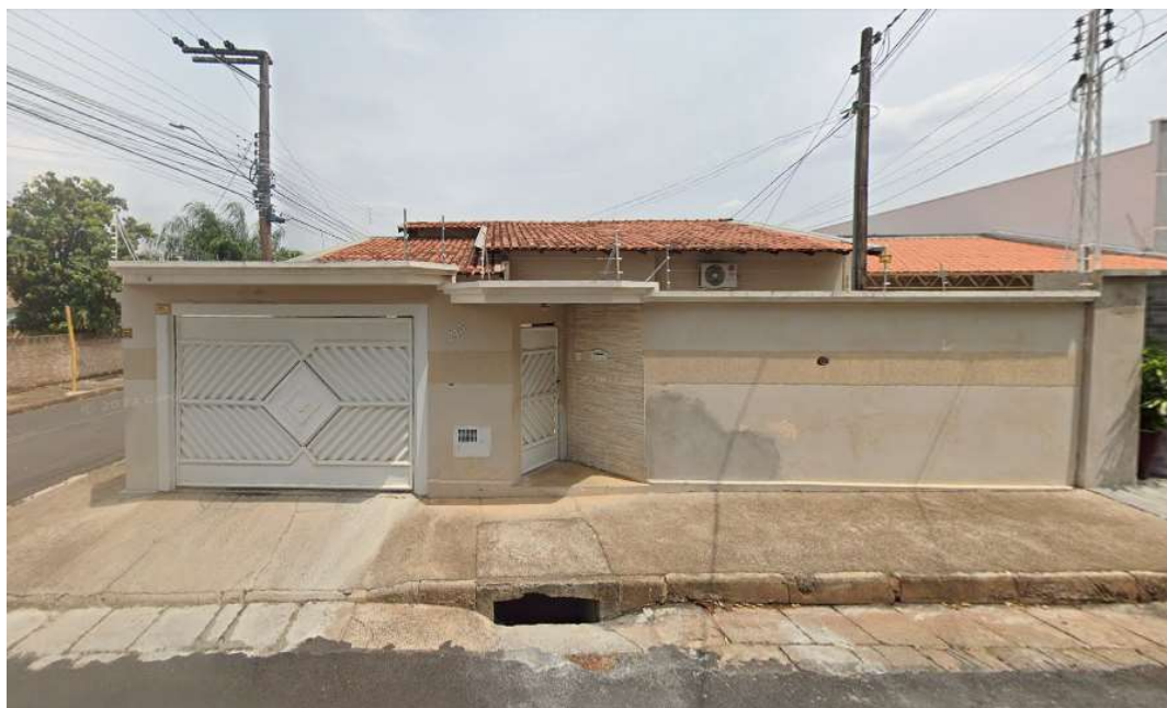
Modelo de edificações residenciais existentes dentro do raio de 100 metros