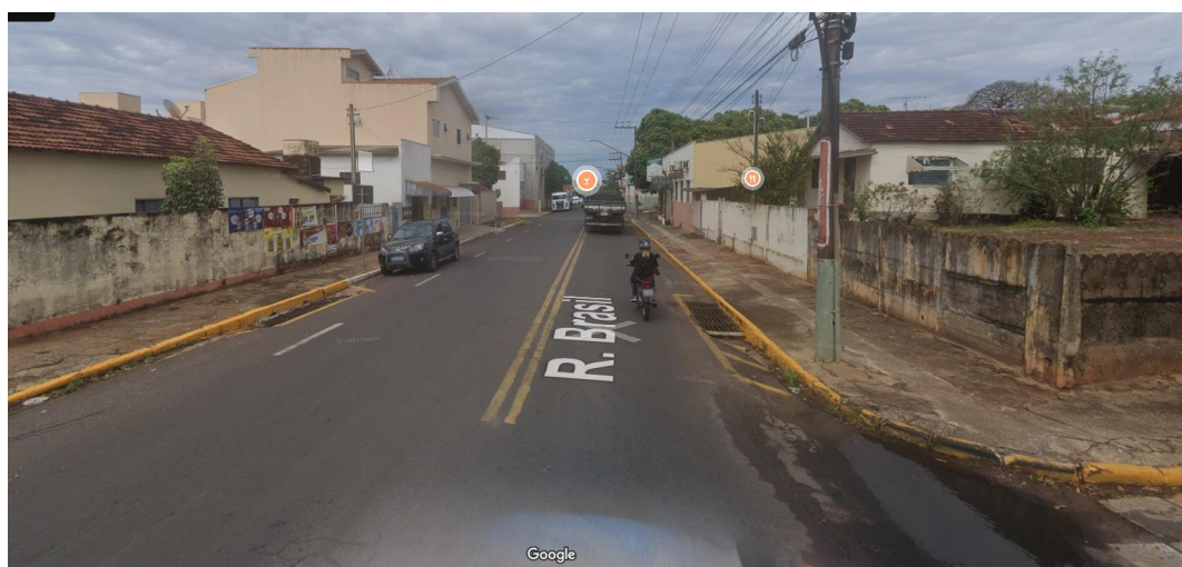
Figura 4- Imagem do entorno. Vista da Rua Brasil sentido Rua Aimorés a Rua Caingangs.