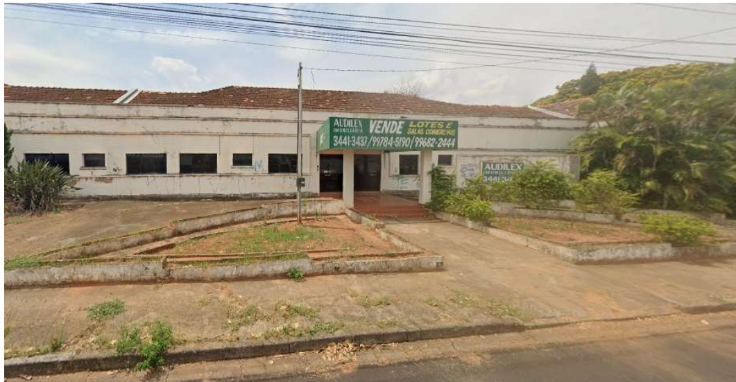
Edificação Institucional desativada – Antigo IPT (Instituto de Psiquiatria de Tupã)