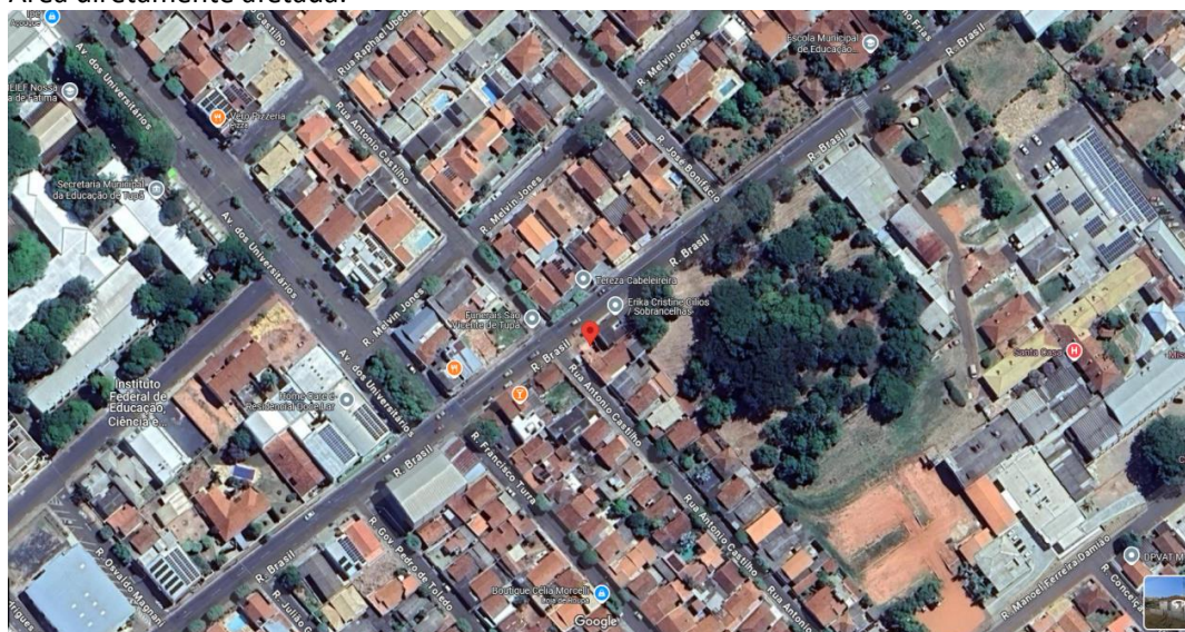
Figura 1- O terreno está localizado em Zona de Preferência Empresarial. Possui em seu entorno a presença variada em serviços, comércios, escola, hospital e residências.