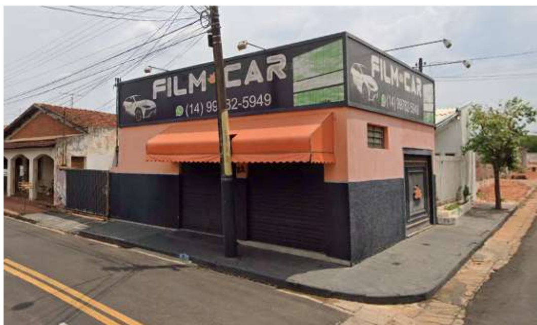
Edificação comercial destinada a atividade de insulfilm de carros