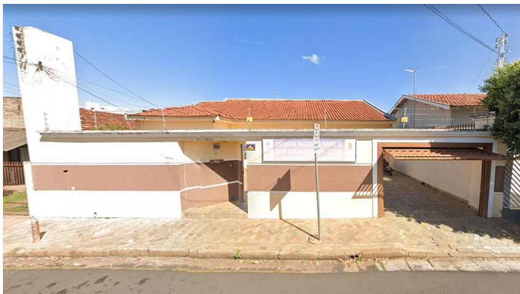
Unidade Saúde da Família á 100 metros do terreno de estudo