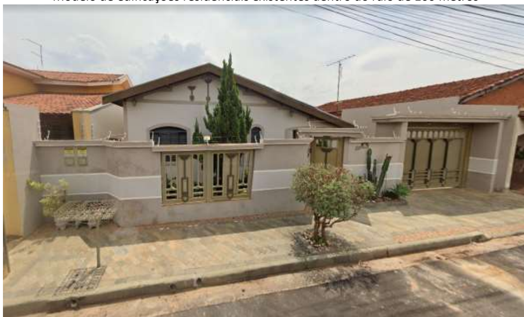
Modelo de edificações residenciais existentes dentro do raio de 100 metros