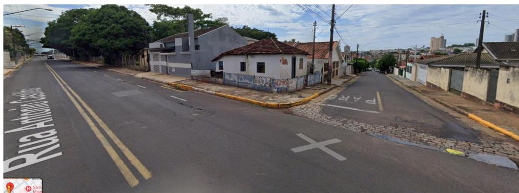
Figura 3- Imagem do entorno. Vista do Cruzamento das Ruas Antônio Castilho e Rua Brasil.