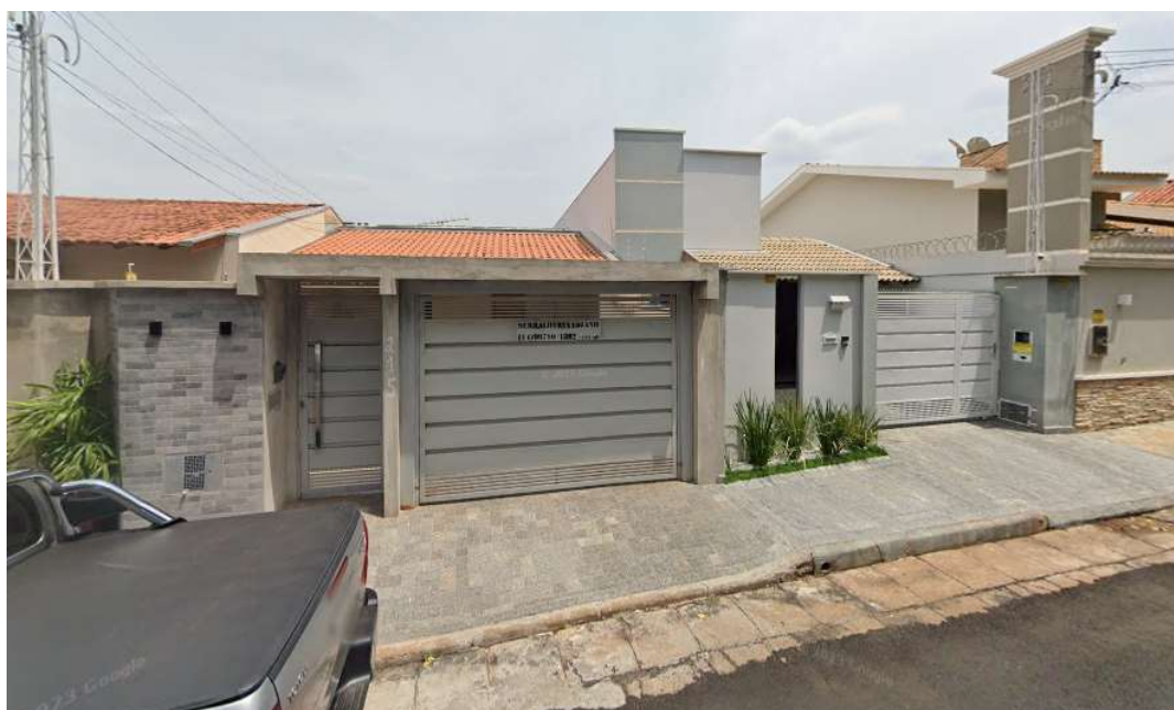
Modelo de edificações residenciais existentes dentro do raio de 100 metros