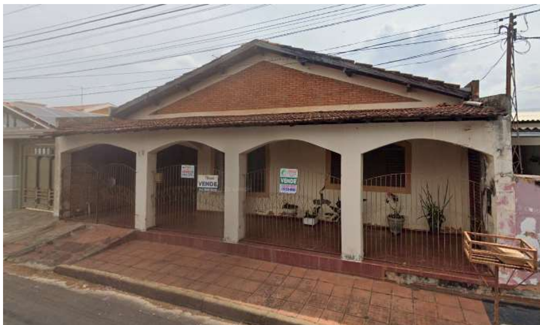
Modelo de edificações residenciais existentes dentro do raio de 100 metros