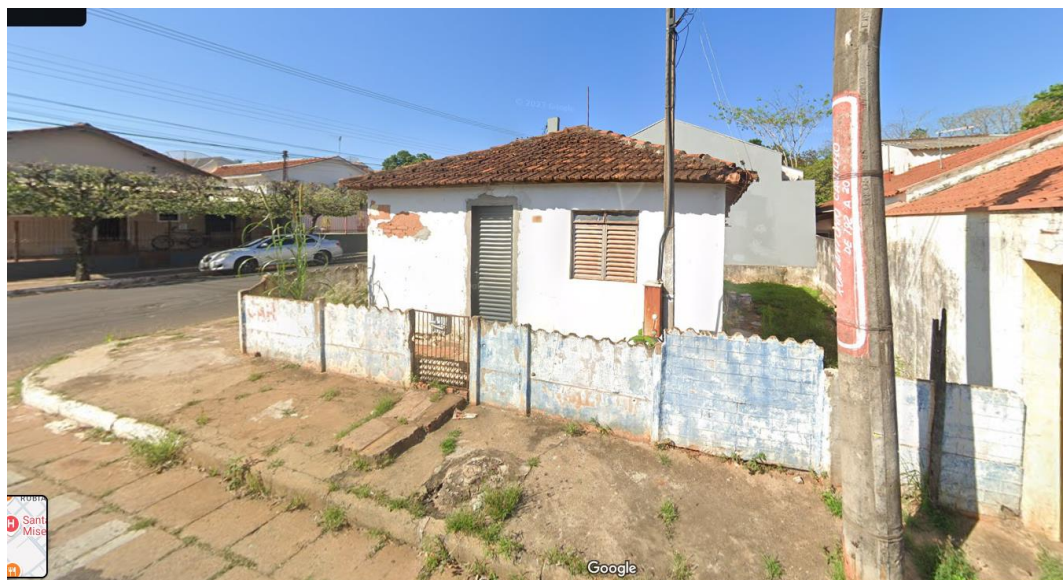
Figura 2- Imagem do terreno com a construção existente / averbada que está sendo reformada. A frente do Terreno é voltada para a Rua Antônio Castilho e a Lateral esquerda do terreno tem a Rua Brasil como confrontante.