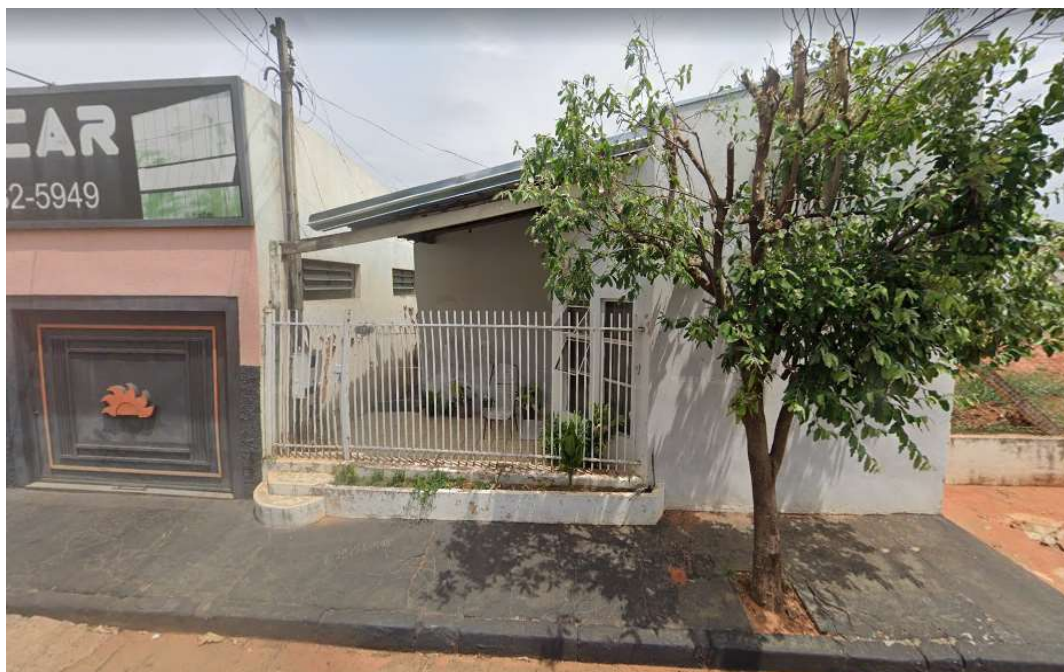
Modelo de edificações residenciais existentes dentro do raio de 100 metros