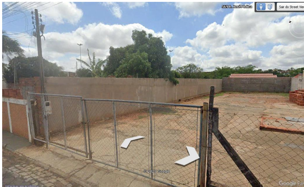
Lado direito, depósito de materiais