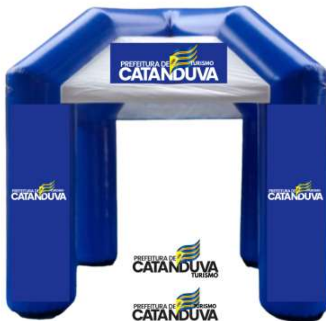
Modelo (Imagem meramente ilustrativa)