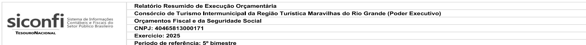
RREO-Anexo 02 | Tabela 2.0 - Demonstrativo da Execução das Despesas por Função/Subfunção | Total das Despesas Exceto Intra-Orçamentárias