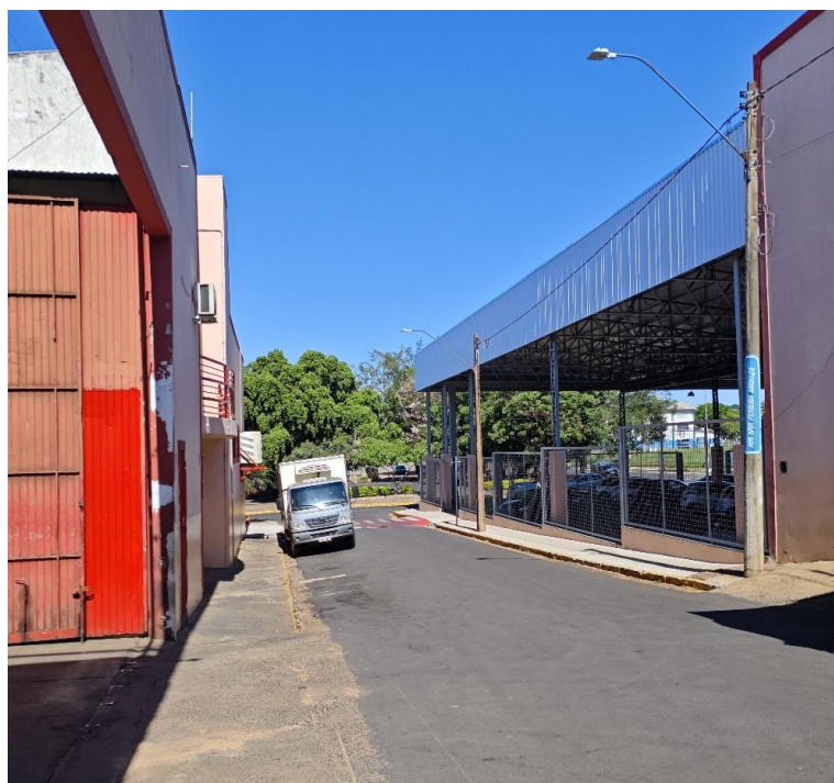
Vista da Rua Nair Ferreira Barbosa ( lateral direita ) sentido Rua Liberdade.

PROCX EMPREENDIMENTOS LTDA – EPP CNPJ: 08.705.468/0001-93 INSCRIÇÃO ESTADUAL: 697.087.583.119