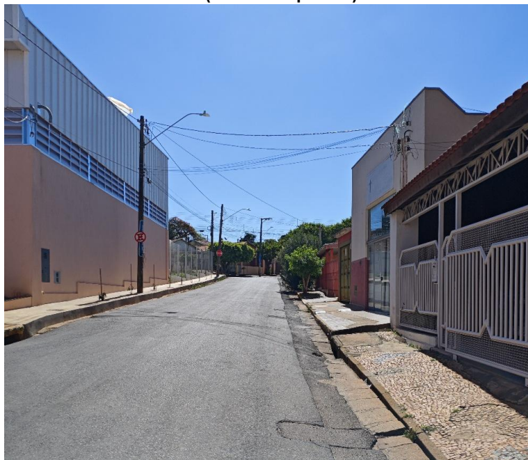
Vista da Rua Nair Ferreira Barbosa ( lateral esquerda ) sentido Rua Abel Ferreira Leite.