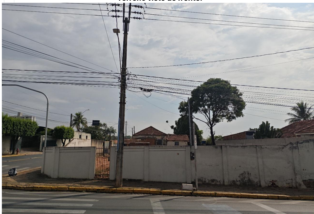
Terreno visto de frente.

PROCX EMPREENDIMENTOS LTDA - EPP CNPJ: 08.705.468/0001-93 INSCRIÇÃO ESTADUAL: 697.087.583.119