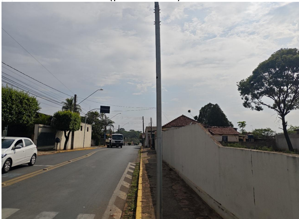
Vista da Rua Brasil ( para frente da rua ) sentido Rua Tocantins.