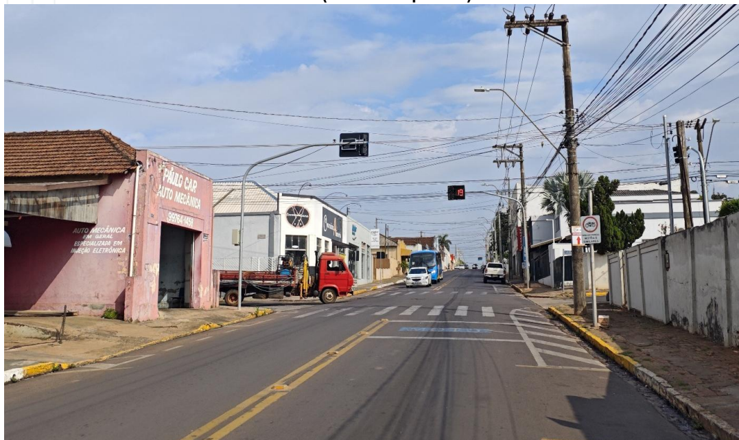
Vista da Rua Aimorés ( lateral esquerda ) sentido bairros.