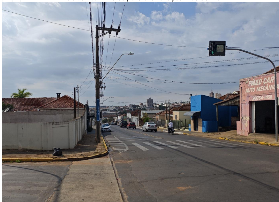
Vista da Rua Aimorés ( lateral direita ) sentido Centro.

PROCX EMPREENDIMENTOS LTDA – EPP CNPJ: 08.705.468/0001-93 INSCRIÇÃO ESTADUAL: 697.087.583.119