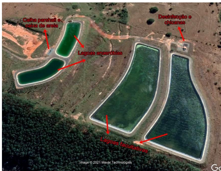
Figura 3. Imagem aérea mostrando a disposição da ETE-Sul.

Inaugurada em agosto de 2021, com licença de operação a título precário, a ETE-sul trata 60% do esgoto produzido pelo município. O tratamento é realizado por um sistema de lagoas australianas, com as seguintes etapas: gradeamento, caixa de areia e calha parshall, seguindo para duas lagoas anaeróbias e duas lagoas facultativas, ligadas em paralelo e por fim desinfecção com cloro e tanque de contato em chicanas. O sistema foi projetado para tratar em média 205 m 3 /h.