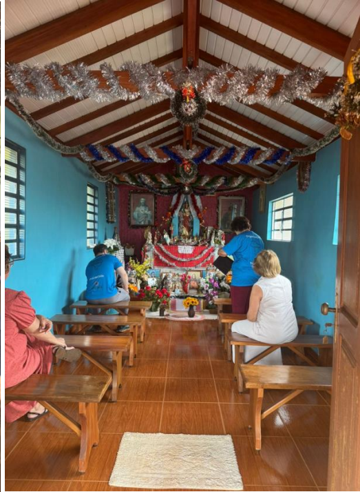
Conselheiros do Comtur Sertãozinho visitam Fazenda Hotel e Capelinha rural