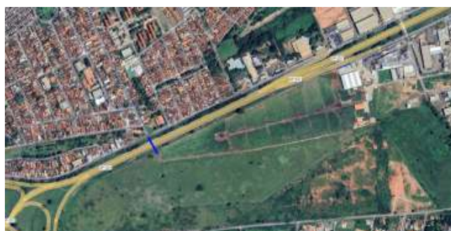
Figura 1: Dispositivo em estudo

A Figura 1 apresenta a localização do novo viaduto em estudo.