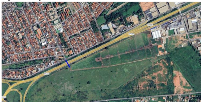
Figura 1: Dispositivo em estudo

A Figura 1 apresenta a localização do novo viaduto em estudo.