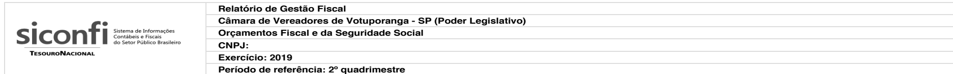
RGF-Anexo 01 | Tabela 1.0 - Demonstrativo da Despesa com Pessoal