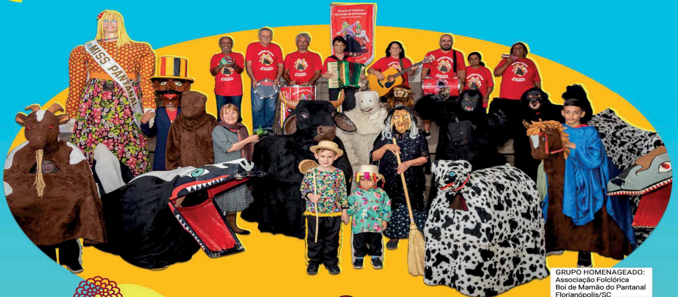
GRUPO HOMENAGEADO: Associação Folclórica Boi de Mamão do Pantanal Florianópolis/SC

ESTÂNCIA TURÍSTICA DE OLÍMPIA - CAPITAL NACIONAL DO FOLCLORE