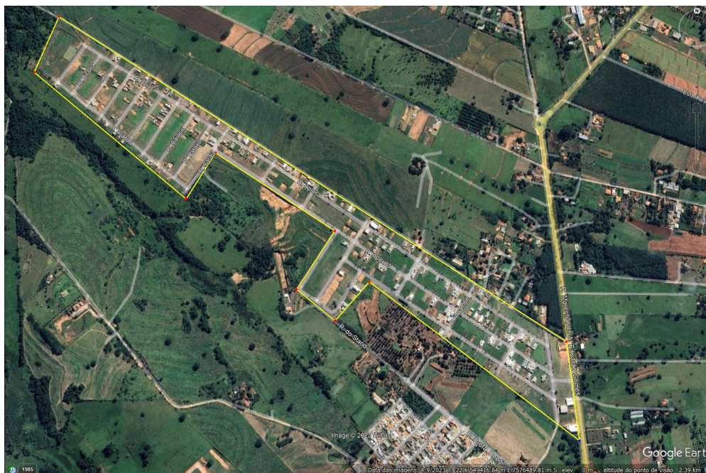
Imagem 03: Bairro Residencial Reserva Tupã, Tupã – SP.

Os imóveis estão na Zona Preferencialmente Residencial, conforme mapa disponível no site da prefeitura de Tupã: https://tupa.1doc.com.br/b.php?pg=o/consulta