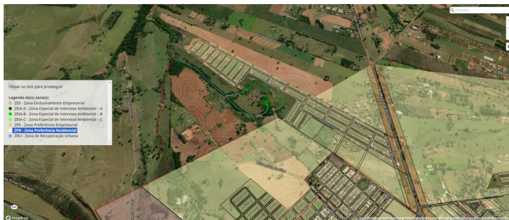
Imagem 04: Mapa retirado do site oficial da prefeitura de Tupã – SP