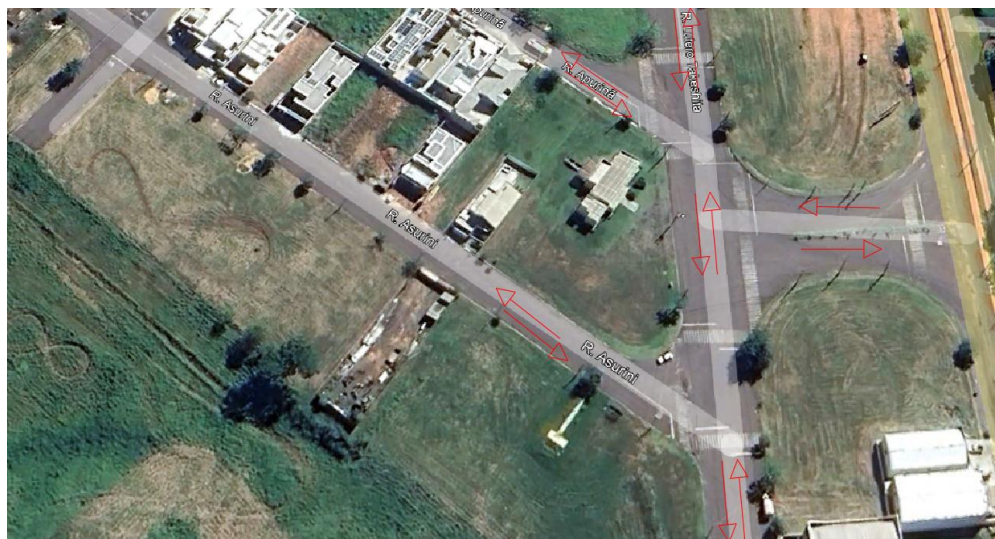
Imagem 05: Sentido do tráfego de veículos ao redor dos lotes.