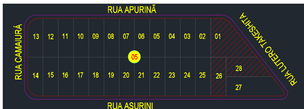
Imagem 01: Demarcação e localização dos lotes no mapa de implantação.

Outras informações, como planta baixa, planta de implantação, cortes e fachada estão contidas na Análise de Projeto 702/2023, código nº 867.916.935.916.521.858, em anexo.