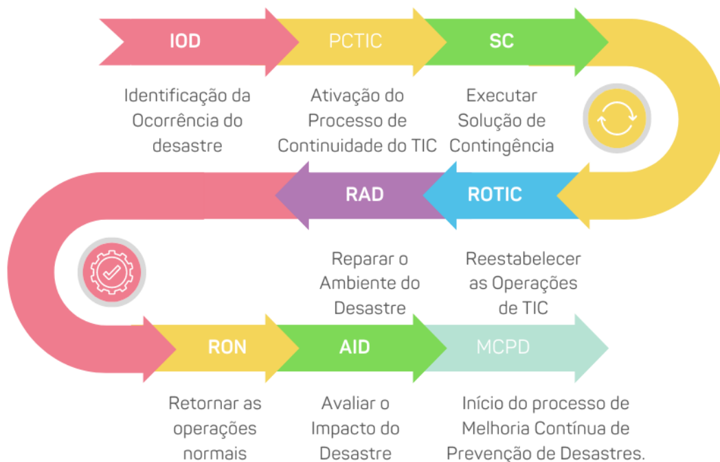
Figura 1: Linha do tempo do Plano de Continuidade.