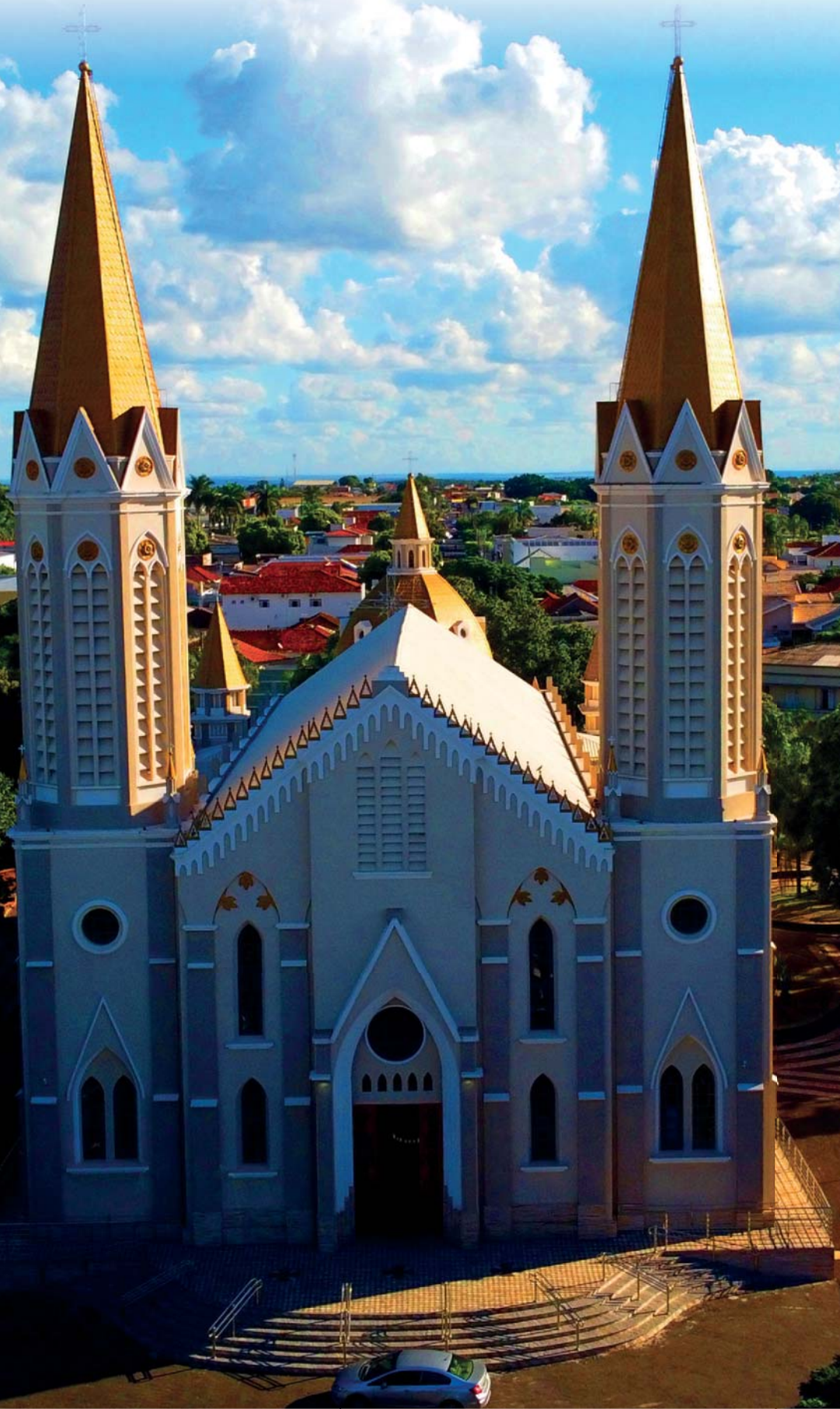
Imagem: Tupã, 16/01/2024, às 12:00:30 (GMT-03:00).

Final, acesso: https://www.tupa.br/portal/doc