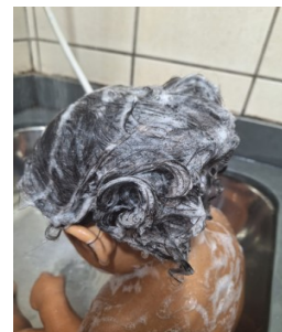
SHAMPOO TRÁ LÁ LÁ