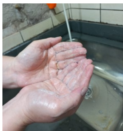
SABONETE LIQUÍDO LSV