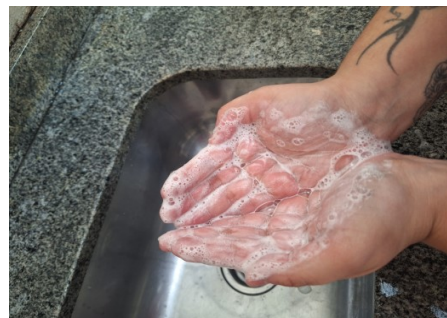
SABONETE LIQUÍDO KELMINHA