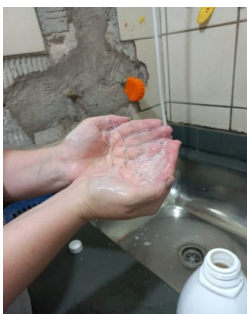
SABONETE LIQUÍDO RILO