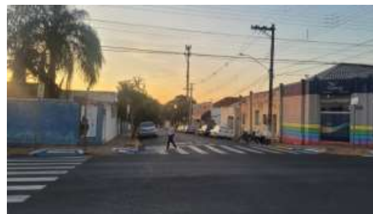
Foto 04 - Testada do Imóvel com frente para a Rua Bororós