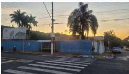
Foto 03 - Testada do Imóvel com frente para a Avenida Tamoios