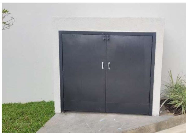
Modelo de Abrigo de Óleo a ser utilizado

O único efluente líquido a ser produzido no local é o óleo de cozinha que será utilizado para cocção de alimentos. Como medidas mitigadoras será instalado um abrigo para guarda dos 02 toneis de óleos utilizados com as seguintes dimensões: 1,05m x 1,20m x h=1,00m e o mesmo será retirado periodicamente por empresa devidamente licenciada a ser contratada pela locatária do imóvel.