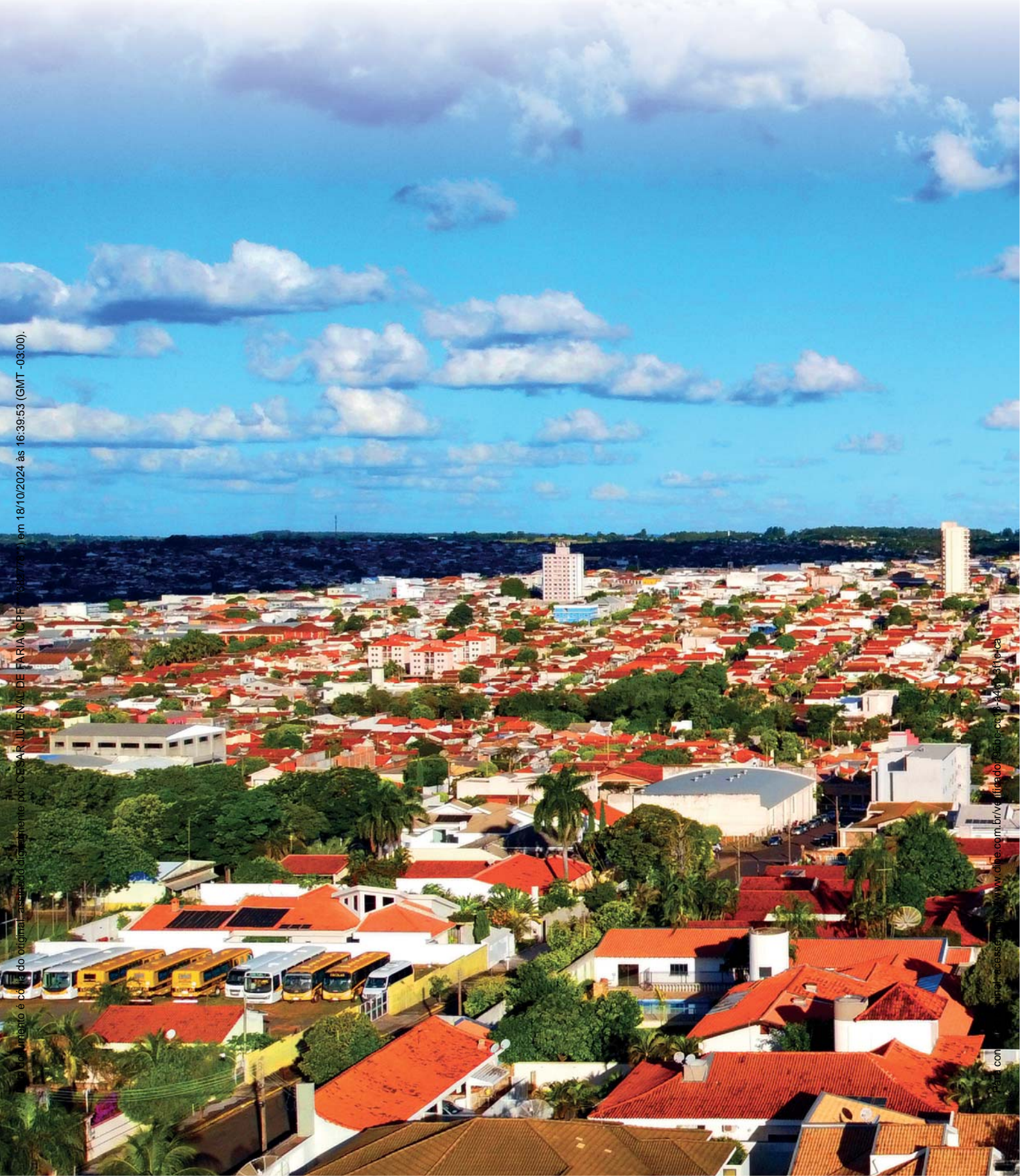
Imagem é cópia do original - assessoria digitalizada por CESAR JUVENAL DE FARIA (CPF: 03877777) em 18/10/2024 às 16:39:53 (GMT -03:00).

Para mais informações, acesse o site www.dioe.com.br ou o aplicativo www.dioe.com.br (versão 1.0.0) em 18/10/2024 às 16:39:53 (GMT -03:00).