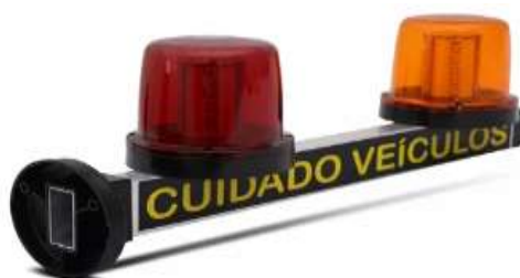
Sinalizador visual e sonoro

SINALIZAÇÃO: Será feita sinalizações horizontais de solo e Será feita sinalizações verticais , bem como sinalizadores de iluminação e sonoro de entrada e saída de veículos