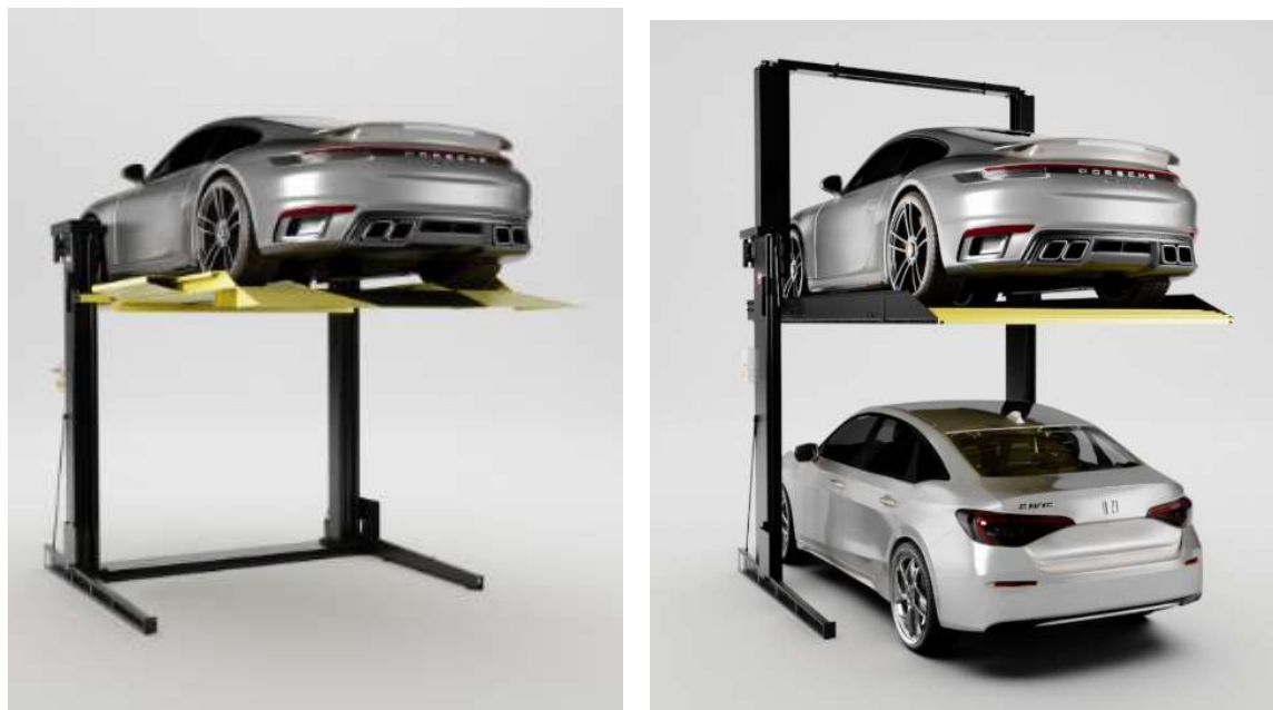
Sistema duplicador de veículos

Com relação aos impactos positivos conclui-se que o empreendimento de estacionamento para o setor do comércio local e apoio à vizinhança, e demais usuários urbanos estão próximo sou transeuntes, bem como a fomentação para o comércio geral a aos prestadores de serviços próximos serão também beneficiados por haver mais uma opção estacionamento na região.