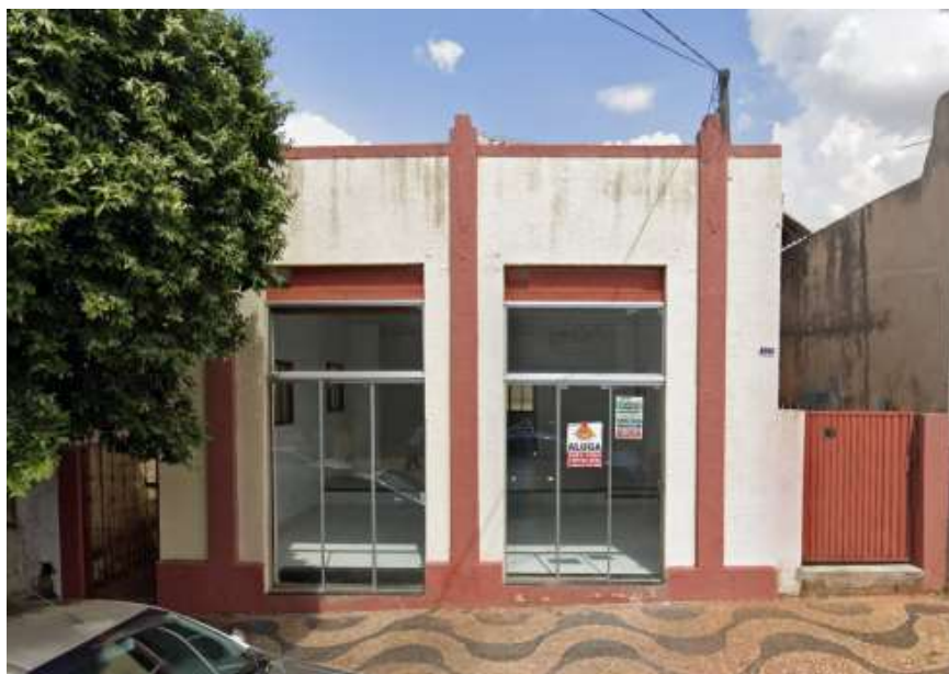
Lateral esquerda - Comercial