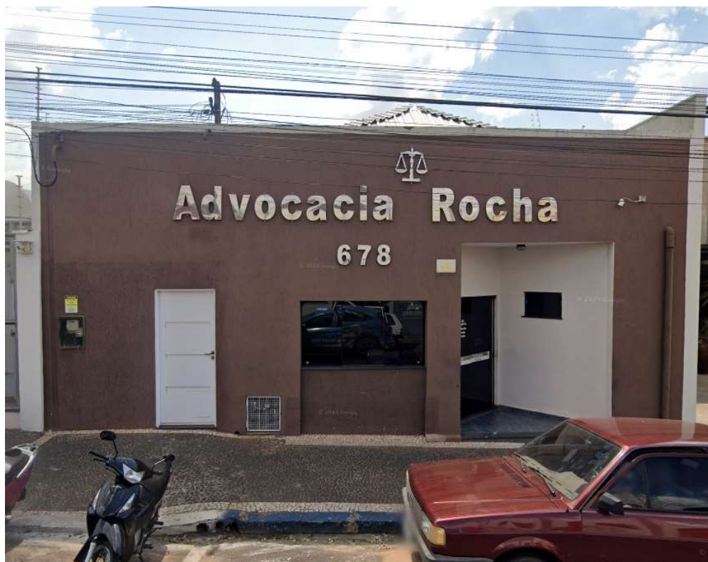
Frontal - Imóvel com uso de prestação de serviços

Visualmente pode-se verificar a área do terreno do local deste estudo que objetiva apresentar o (EIV) Estudo de Impacto de Vizinhança no formato de seu respectivo (RIV) Relatório de Impacto de Vizinhança em nada dará oposição quanto a implantação do empreendimento