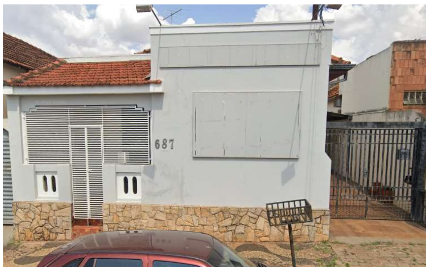
Lateral direita - Residência