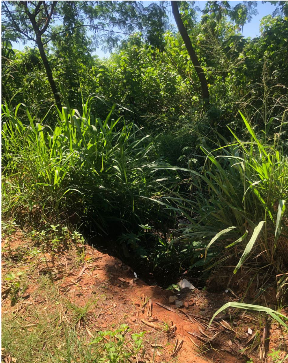
3: imagem de erosão paralela a estrada.