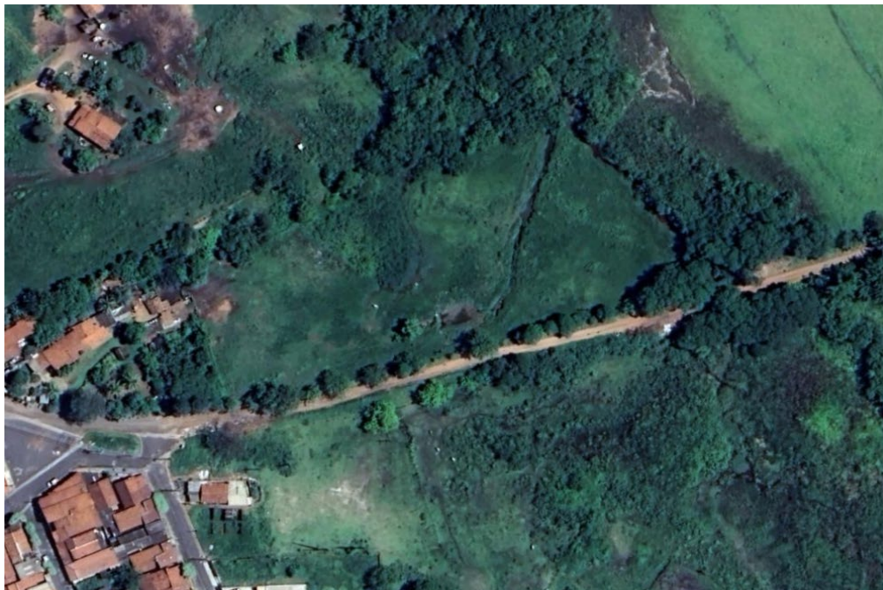
Imagem 2: imagem de área de intervenção.