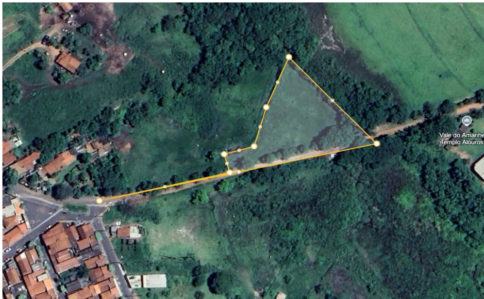
Imagem 1: imagem de polígono de área de intervenção.

coordenadas: Ponto 1 - 21°39'15"S e 49°50'42" W; 2 -21°32'12" S e 49°50'35" W; 21°32'11" S49°50'38" W.