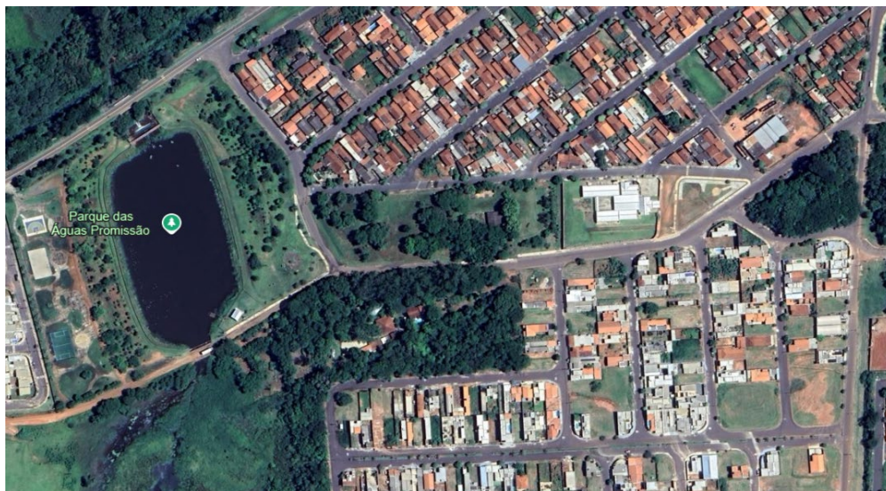
Imagem 14: imagem de área de intervenção.

13: imagem de polígono de área de intervenção.