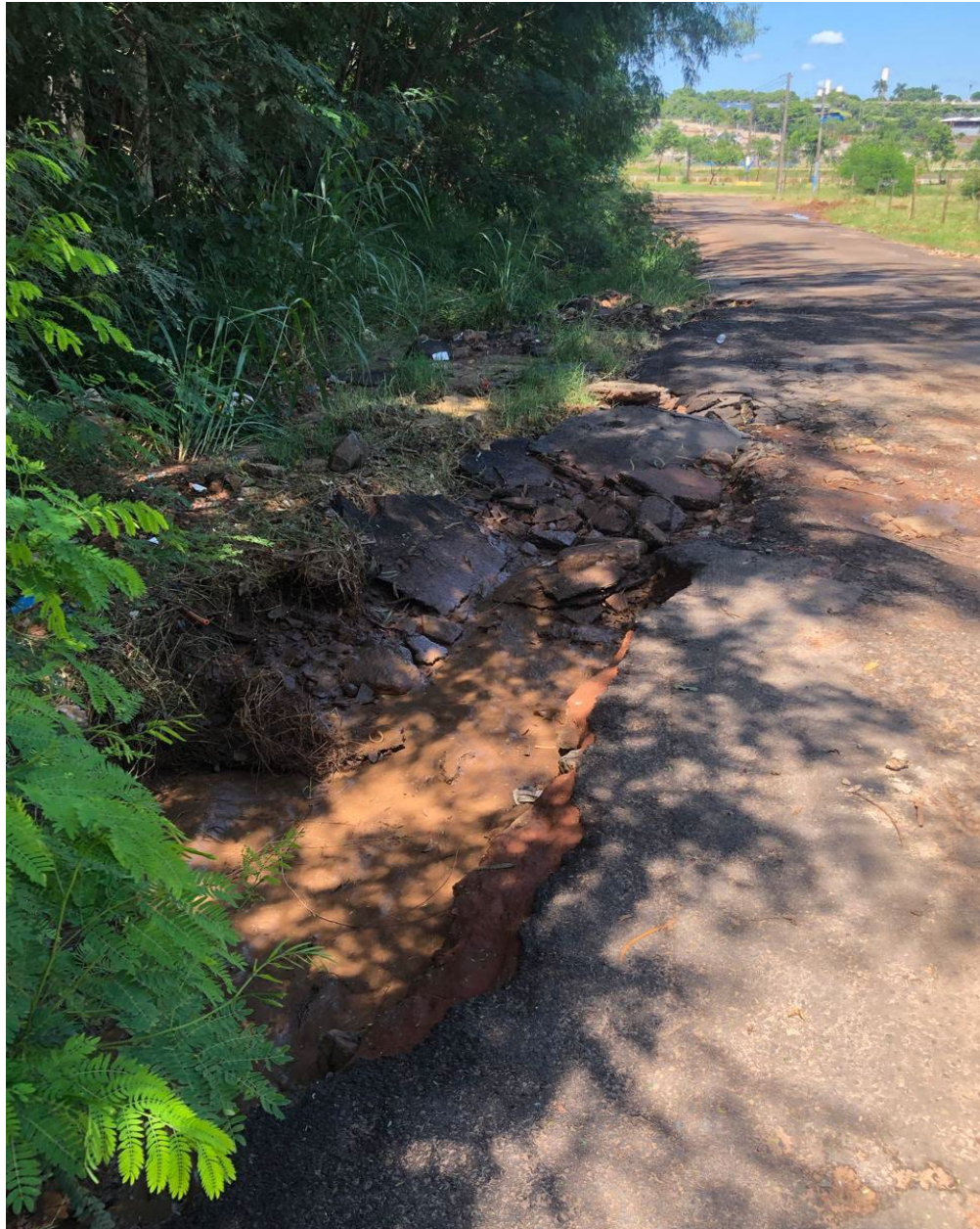
estrada. Imagem 21: imagem processo erosivo na