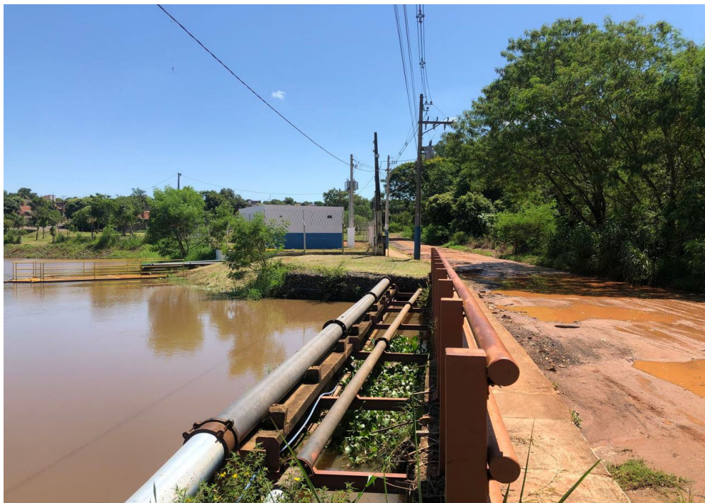
Imagem 22: imagem de montante de captação sofrendo assoreamento e lixiviação.