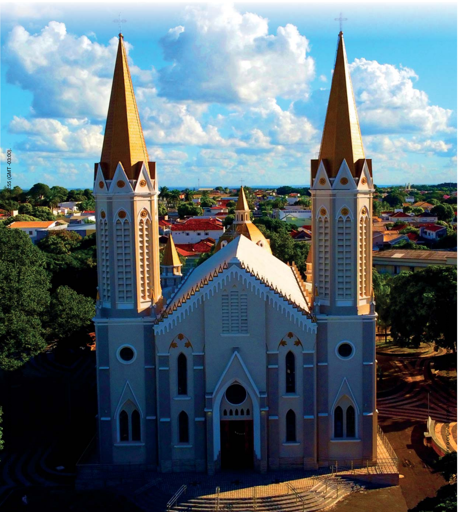
Imagem: Prefeitura de Tupã, 09/04/2025 às 18:28:55 (GMT -03:00).