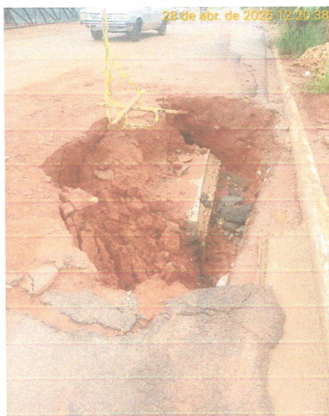
Foto 04 – Erosão no PV 07 localizado na Avenida José Vieira de Souza, com risco eminente ao pavimento existente e aos munícipes que ali trafegam. Sinalização inadequada.