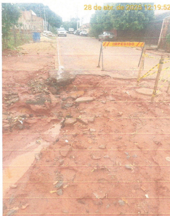
Foto 02 – Erosão no PV 06 localizado na Avenida José Vieira de Souza