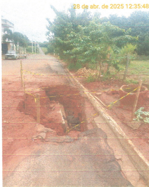
Foto 03 – Erosão no PV 07 localizado na Avenida José Vieira de Souza, com risco eminente ao pavimento existente e aos munícipes que ali trafegam. Sinalização inadequada.

Fone (17) 3272-9000 - CNPJ 45.157.104/0001-42