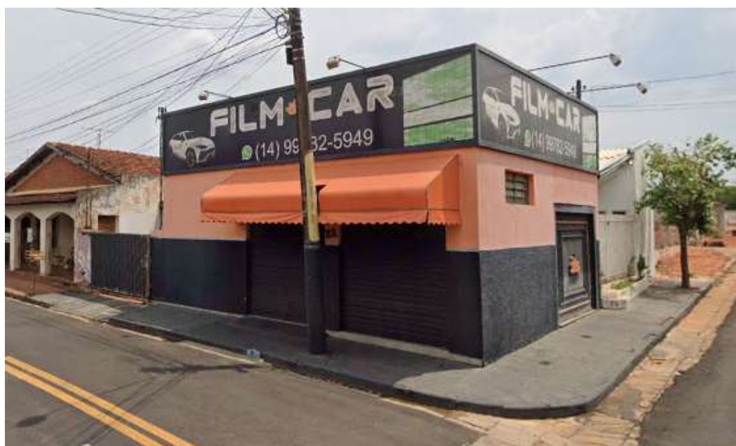
Edificação comercial destinada a atividade de insulfilm de carros