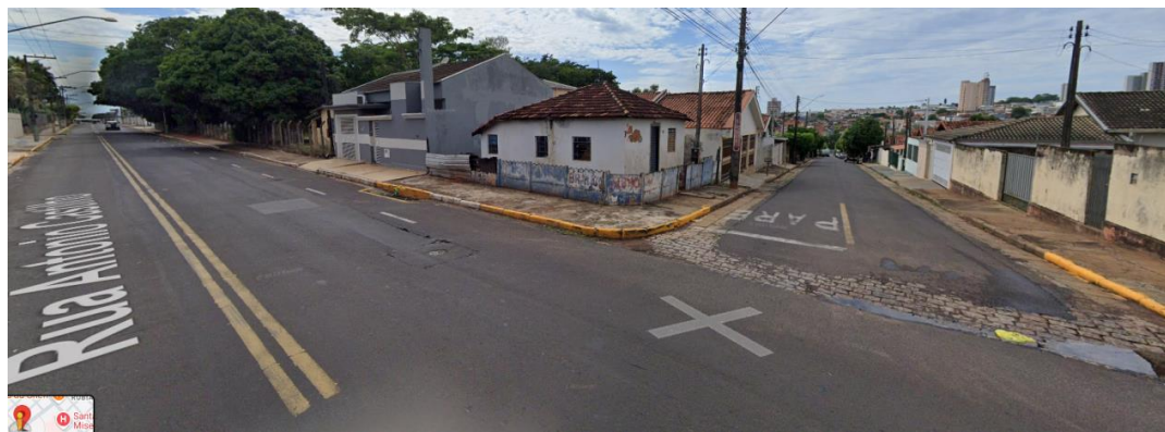
Figura 3- Imagem do entorno. Vista do Cruzamento das Ruas Antônio Castilho e Rua Brasil.