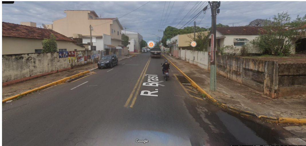
Figura 4- Imagem do entorno. Vista da Rua Brasil sentido Rua Aimorés a Rua Caingangs.