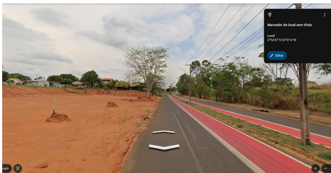
Imagem do local do empreendimento.