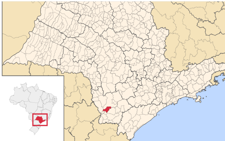
Figura 2: localização do município de Nova Campina no Estado de SP