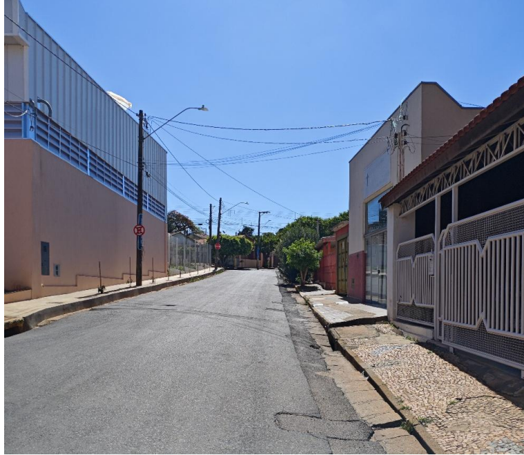
Vista da Rua Nair Ferreira Barbosa ( lateral direita ) sentido Rua Liberdade.