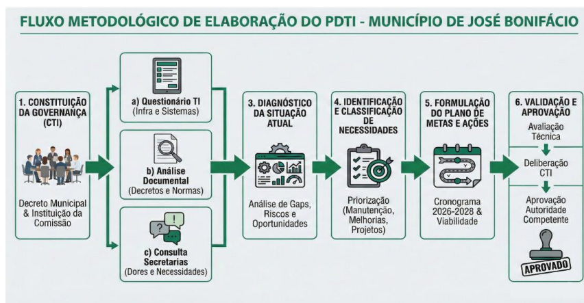
Figura 1. Fluxo Metodológico de Elaboração do PDTI - José Bonifácio/SP

Gabinete do Prefeito Superintendência Executiva "Dr. Ruy Barbosa Lima"