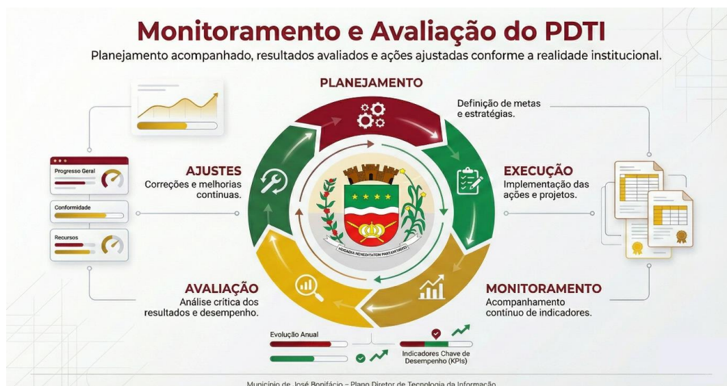
Município de José Bonifácio – Plano Diretor de Tecnologia da Informação Figura 7. Monitoramento e Avaliação do PDTI

Os resultados do monitoramento e da avaliação do PDTI devem ser documentados e disponibilizados de forma adequada, garantindo transparência administrativa e facilitando a fiscalização pelos órgãos de controle. A prestação de contas fortalece a governança e demonstra o comprometimento institucional com o planejamento e a boa gestão dos recursos públicos.