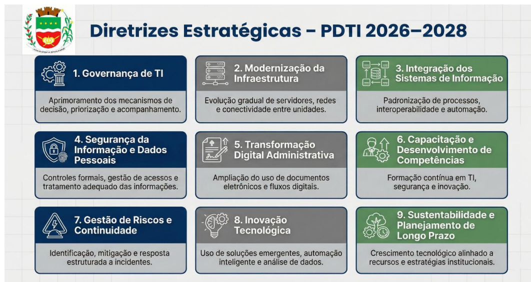
Figura 4. Diretrizes Estratégicas.

Gabinete do Prefeito Superintendência Executiva "Dr. Ruy Barbosa Lima"