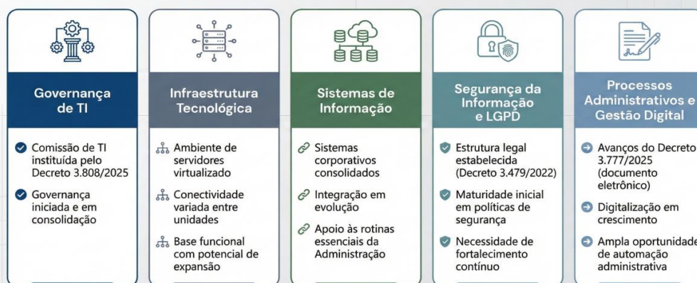
Figura 2. Diagnóstico da Situação Atual.